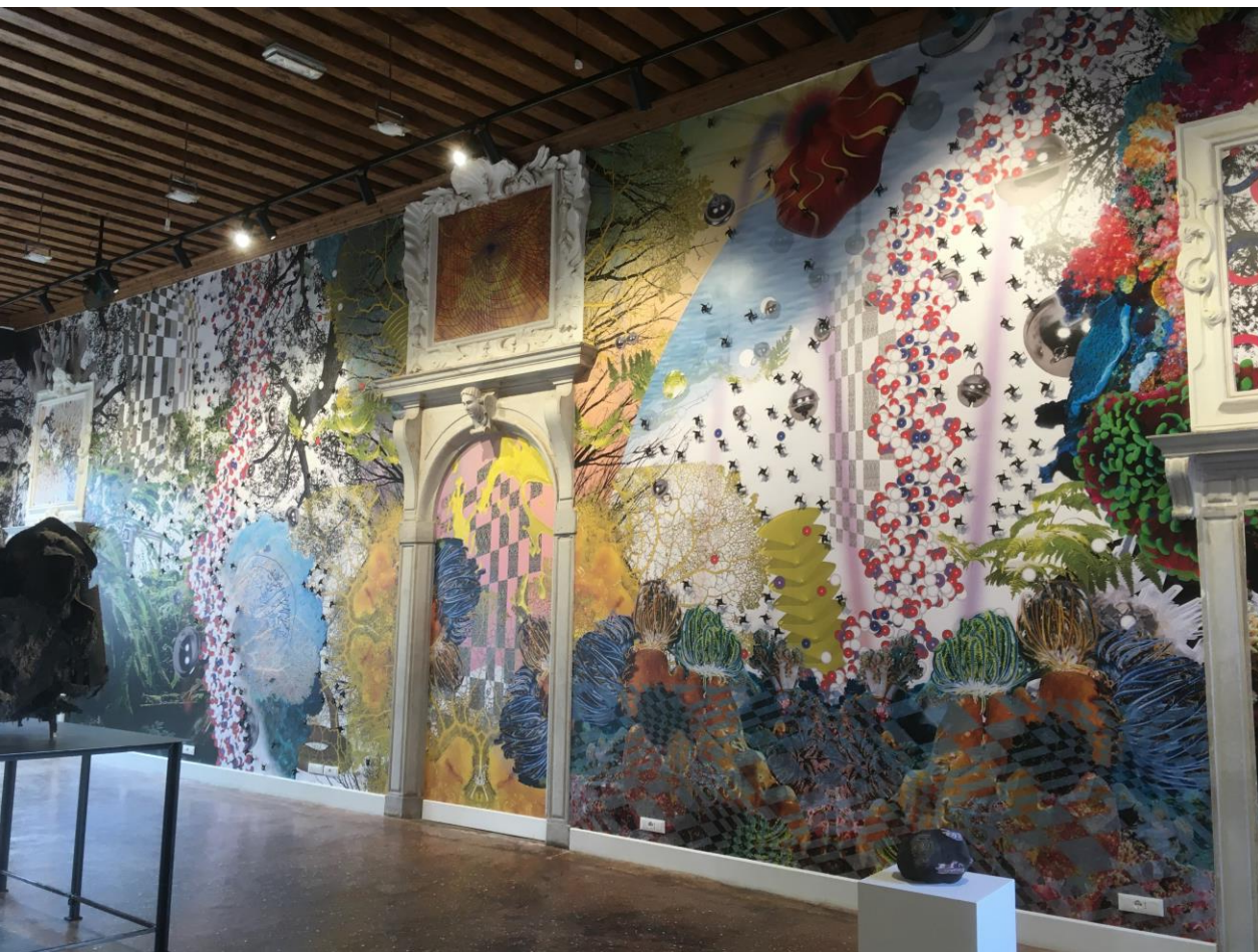
Výstava Planet B, Benátky 2022