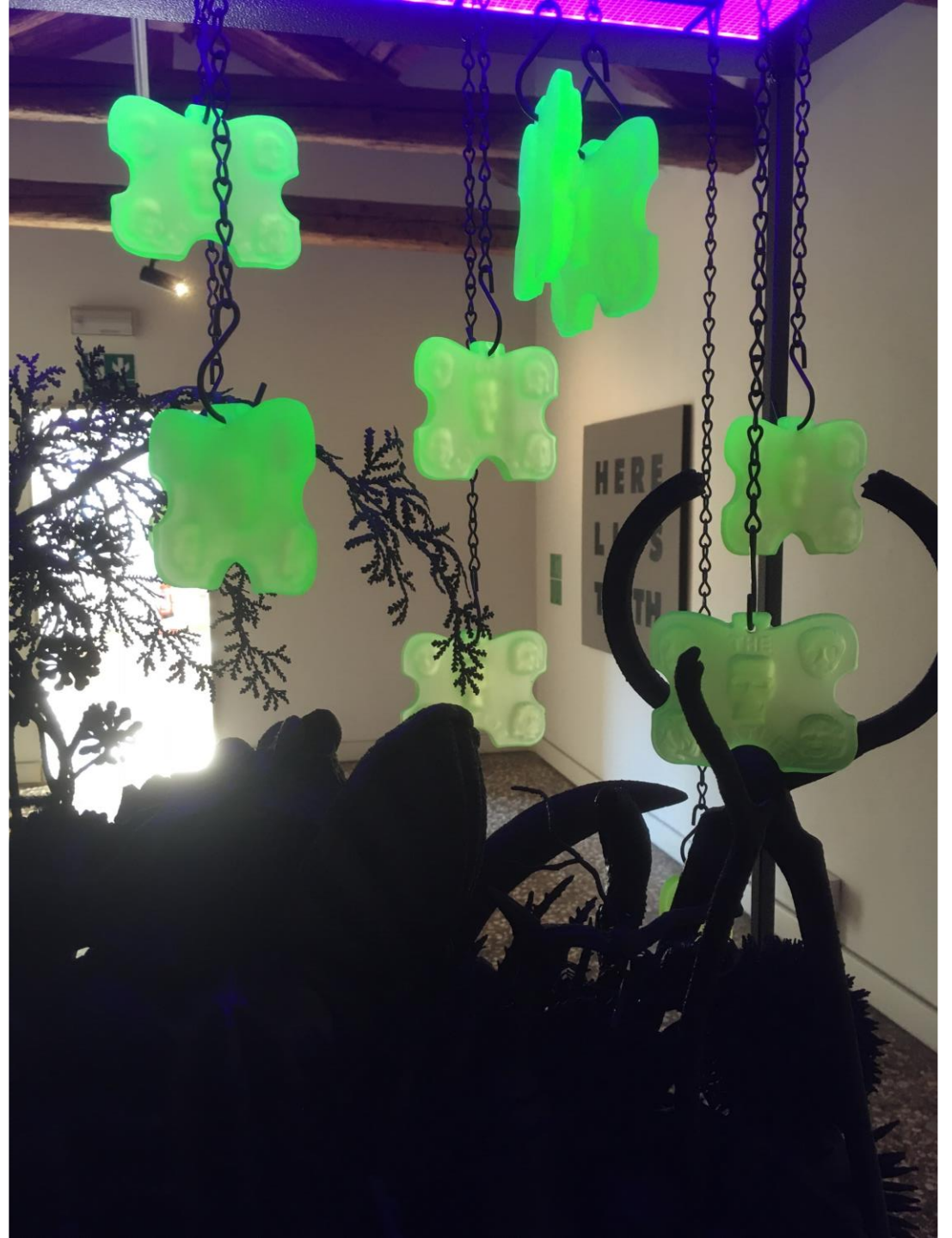
Max Hooper Schneider, The Beatles, 2022