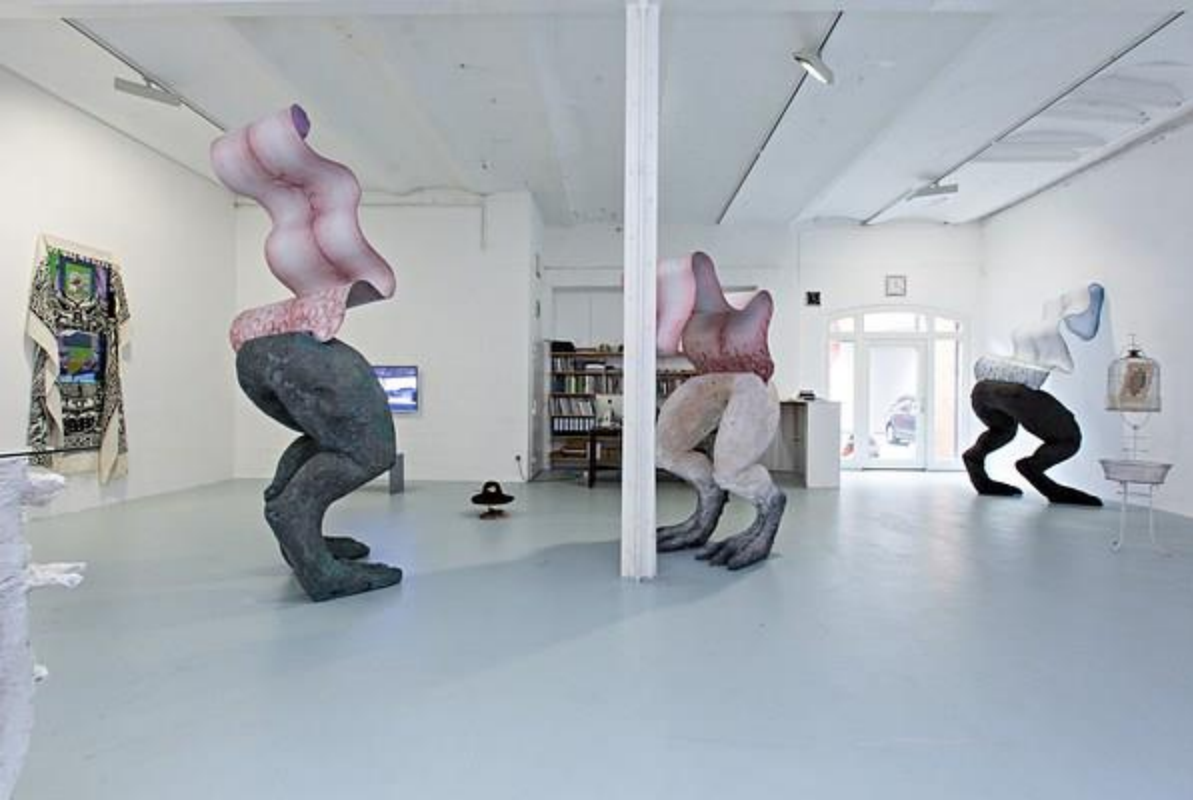
Fantasie (2016), Gebärden und Ausdruck (2016) Authentizität. Das Authentisch Unauthentische (2017) Lüneburg