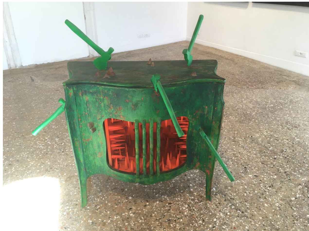
Nicolás Uriburu, Victim and victimizer, 1975