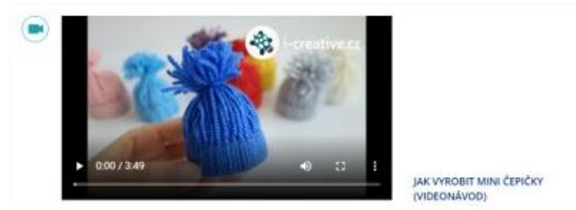
JAK VYROBIT MINI ČEPIČKY (VIDEONÁVOD)