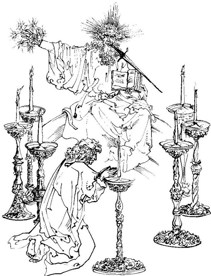
Sv. Jan Evangelista se klaní apokalyptickému Bohu s mečem v ústech

na, Bartoloměje) a zejména novozákonní prorocky-apokalyptická kniha Zjevení Janovo . Jde v ní o vyplnění mesianistických proctví o konečném vítězství Božím nad Satanem. Raní křesťané v době před Konstantinem události v textu popsané očekávali ještě za svého života. Později zvítězila představa, že v knize Zjevení je líčen čas plynoucí ke konci věků, který je ohraničen na jedné straně smrtí a zmrtvýchvstáním Krista, na straně druhé jeho opětovným příchodem (parusie). Autor Zjevení Janova sám sebe nazývá Janem a v 1. století po Kr. byl ztotožněn se sv. Janem Evangelistou, což