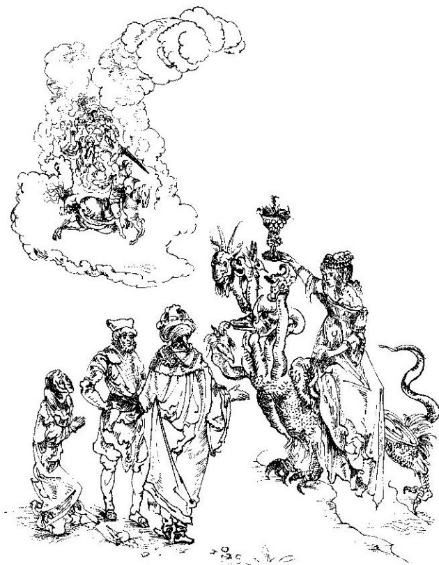
Vidění babylonské nevěstky

(např. kaple sv. Kříže na Karlštejně, kaple sv. Karla Velikého v Cáchách, St. Chapelle v Paříži) se velmi často setkáváme s poukazem na Nebeský Jeruzalém.