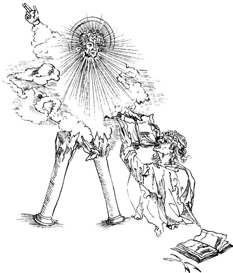
Anděl se zářící tváří a s nohama jako ohnivé sloupky přimulil sv. Jana Evangelistu sníst knihu

deni už vředy, se neobrátili; 6. nádoba – byla vylita na řeku Eufkrat a ta vyschla, aby byla připravena cesta králům východu slunce. Z úst lživého proroka vystoupili tři nečistí duchové, kteří shromáždili krále tohoto světa k boji proti Všemohoucímu na místě zv. hebrejsky Harmagedon; 7. nádoba – byla vylita do ovzduší a z chrámu zazněl hlas Boží: „Stalo se.“ Nastalo zemetřesení, veliké město se roztrhlo na tři části, ostrovy a hory zmizely a na lidi padaly velké kroupy. Jeden ze sedmi andělů pak vyzval Jana, aby byl svědkem soudu nad