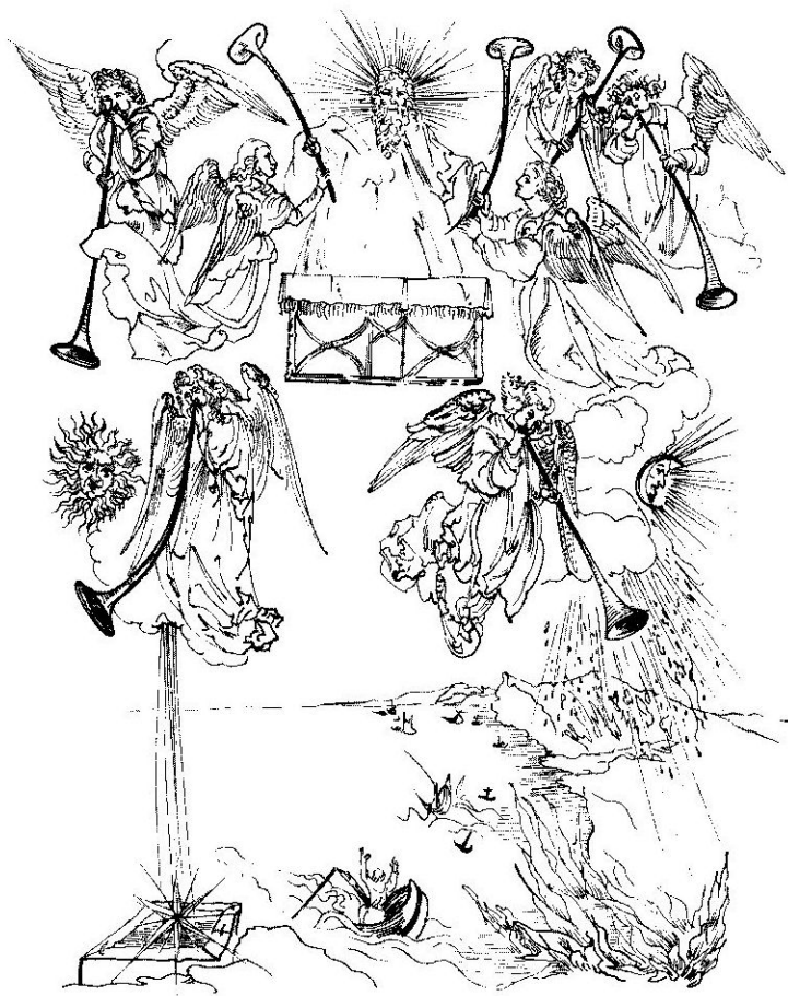
Po rozlomení sedmé pečeti sedm andělů zatrumbilo a třetina země vzplanula, lidé hynuli na zemi i na moři a z nebes spadla hvězda zvaná Pělměk

Pozoruhodné vyobrazení apokalyptické ženy - alegorie Církve nalezneme v Liber depictus (1320, Vídeň, ÖNB). Okřídlená ženská postava přidržuje na pravém boku oblečeného Krista s knihou v ruce a střední část těla jí zakrývá velký sluneční kotouč s polopostavou Bolestného Krista. Žena „v slunci oděná“ byla těhotná a ohrožoval ji drak - Satan. Archanděl Michael a jeho andělé se utkali s drakem a svrhli ho na zem. Drak začal ženu ohrožovat, ta však dostala křídla a podařilo se jí uletět na poušť, kde porodila syna, a ten má železnou berlou pást všechny národy. Po svrže-