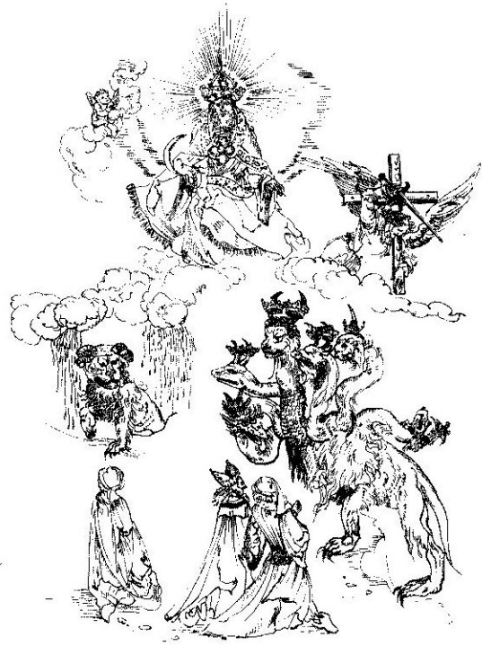
Lidé se klaní apokalyptické šelmě, Bůh se srpem v ruce vysílá anděly ke žnám země

ře; vyjde, aby oklamal národy ve všech čtyřech úhlech světa. Obklíčí město věrných, ale bude poražen a svržen do jezera. Bůh pak na bělostném trůnu přistoupí k soudu nad mrtvými a bude otevřena i Kniha života. Kdo do ní nebyl zapsán, bude vhozen do hořícího jezera.