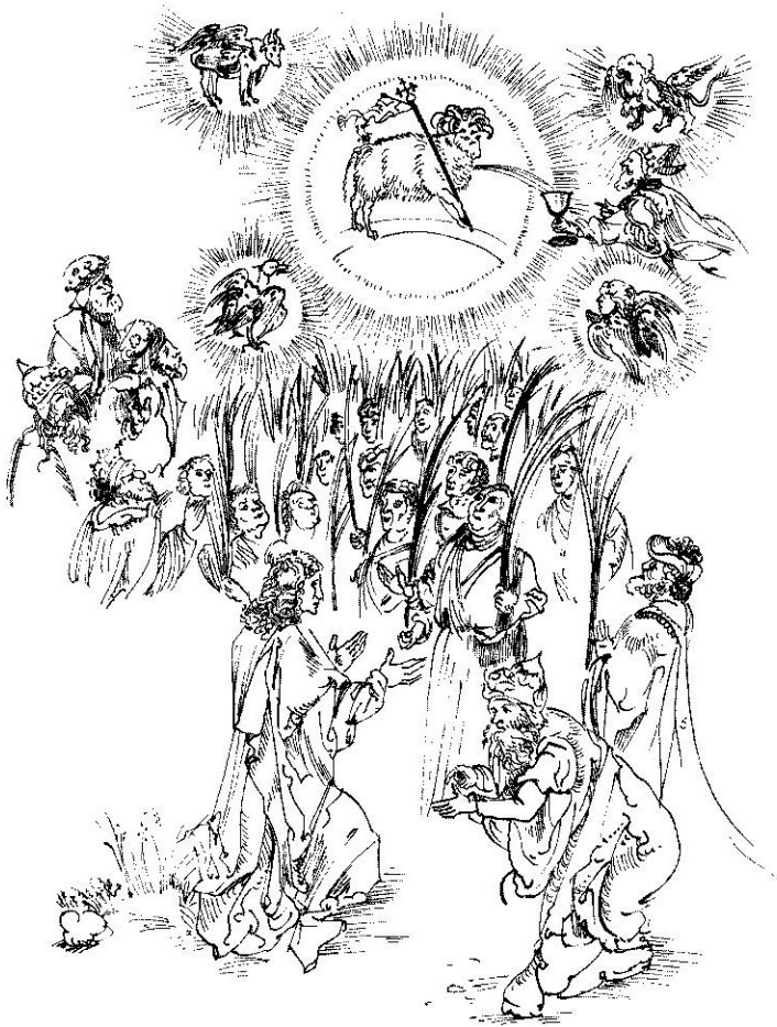
Zástupy mučedníků oblečených v bílá roucha a s palmovými ratolestmi v rukou chválí Boha

mením Božím. Kobylinky měly lidskou tvář, hřívu jako vlasy žen, na hlavě cosi jako zlaté věnce, zuby jako lvi, na těle jakoby železné pancíře; 6. polnice – rozvázání čtyř andělů spoutaných při veliké řece Eufratu. Dvě stě milionů jezdců s ohnivými pancíři usmrtilo třetinu lidstva, a přesto se lidé dále klaněli modlám. Objevil se též mocný anděl, nad jehož hlavou byla duha, tvář měl jako slunce, nohy jako ohnivé sloupy, v ruce knížečku. Jiný anděl pak vyzval Jana, aby pozřel knihu , což ten učinil. Podobně Jan z příkazu anděla změřil rákosovou mírou chrám (např. nástěnná