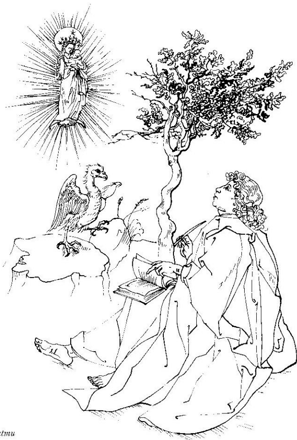
Sv. Jan Evangelista na Patmu

Vlastními prameny Apokalypsy (apokalypsis - zjevení, tajemství) jsou některé prorocké starozákonné knihy ( Daniela, Ezechiela ), starozákonné apokryfy (etiopská kniha Hennochova, Baruchova apokalypsa, Sibylina proroctví ), novozákonné - „synoptické apokalypsy“ ( Mt 25,31-46; Mk 13, 24-27; L 17,20-37 ), novozákonné apokryfní apokalypsy ( Petrova, první a druhá Pavlova, Janova, Marii-