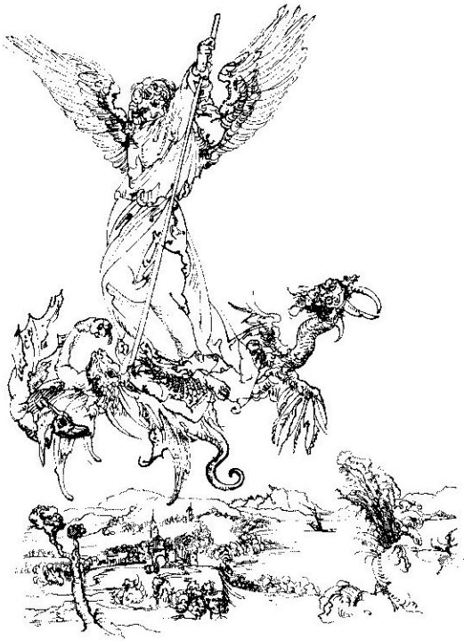
Archanděl Michael bojuje s drakem a poráží ho