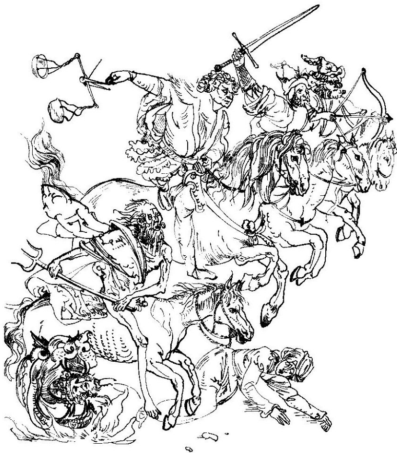
Čtyři apokalyptičtí jezdci

komentář ( Enarrationes in Apocalypsin ) Anselma z Laonu († 1117). Z téže doby pochází výklady Ruperta z Deutz († kol. 1129, Commentaria in Apocalypsim ), Honoria z Autun († 1137), Richarda ze sv. Viktora († 1173, In Apocalypsim Joannis ). Některé heretické aspekty byly shledávány v komentáři mystika Joachima de Fiore († 1202). Aktuální události z církevních dějin (spor císaře Fridricha II. a papežství) promítl do výkladu Zjevení Janova Alexander Minorita († 1271). Velký vliv na zobrazení apokalypsy ve vrcholném středověku, Karlštejnskou apokalypsu nevyjímaje, měl spis Prologus