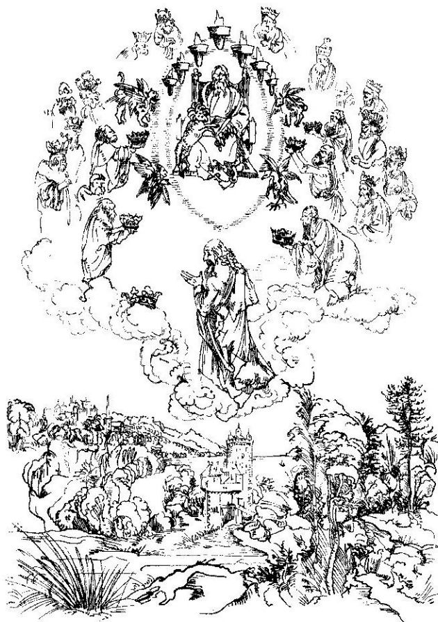
Čtyřiaadvacet apokalyptických starců se klaní Bohu

Pro ikonografii Apokalypsy byly důležité komentáře. Nejstarším je komentář Commentariū in Apocalypsim Ioannis Victorina z Ptujce († 304), který byl i přes odmítnutí některými teology užíván také v dalších staletích. Z Augustinova spisu De doctrina Christiana se dovídáme o existenci ztraceného komentáře donatisty Tyconia († kol. 392). Pojetí Victorinovo a Tyconiovo se snažil spojit ve svém komentáři ( Commentaria in Apocalypsin ) Primasius († kol. 560), biskup z Hadrumenta (Numidie). Na Západě pak velký vliv měly raně středověké komentáře Caesaria z Arles († 542), Cassi-