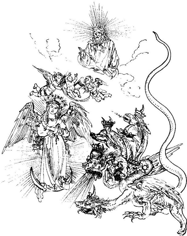
Žena sluncem oděná s měsícem pod nohama a s dvanácti hvězdami kolem hlavy je ohrožována drakem

mátory církve (např. husité anebo Martin Luther) ztotožňována se „zkaženým“ papežstvím. Anděl pak ohlásil pád Babylonu a lidé byli hlasem z nebes vyzváni, aby město opustili. Spravedliví na nebesích děkovali Bohu a 24 starců se čtyřmi bytostmi se mu klanělo. Nastal konečný zápas mezi Kristem a Antikristem . Z otevřených nebes vystoupil bílý kůň a na něm seděl ten, jenž má jméno Věrný a Pravý, neboť soudí a bojuje spravedlivě. Jeho oči jsou plamen ohně a na hlavě má mnoho královských korun. Je oděn do pláště, který je