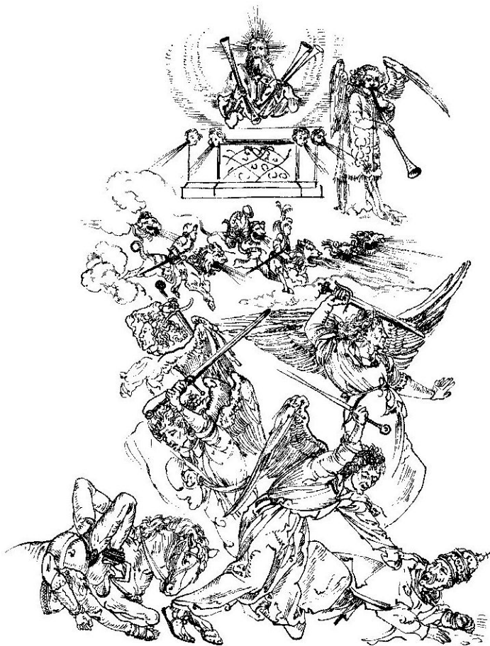
Při šestém zatroubení byli rozvázáni čtyři andělé smrti a byly vyslány jejich jízdní oddíly na lvech chrlicích oheň

Gihon, Eufkrat, Tigris), které jsou podle Paulina z Noly (353-431) symbolem čtyř evangelistů, je zobrazován již na raně křesťanských mozaikách (mozaika v apsidě baziliky v Nole, 4. stol.). Znamením soudu je zjevení Syna člověka se zlatou korunou na hlavě, který v ruce drží srp, jež hodil na zem, aby se započala žeň na vinici Páně . Tu pak dokončil anděl, který vyšel se srpem v ruce z nebeského chrámu a žal hrozny lidí, které pak lisoval ve vinném lisu. Poukaz na žeň na vinici Páně nacházíme již na mozaikách v římském mauzoleu S. Constanza (4. stol.) a v našem