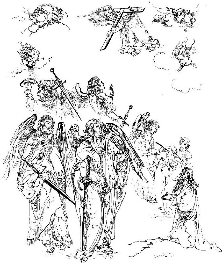
Čtyři andělé spoutávají větry, než anděl označí znamením Božím čela spravedlivých

(jezdec-dobyvatel na bílém koni s lukem; jezdec-zhoubce míru na ohnivém koni s mečem; jezdec-bída na černém koni s váhami; jezdec-smrt na sinavém koni). Jak je často zobrazováno, od těchto hrůz je zachráněno 144 000 označených spravedlivých z pokolení Izraele a další „ze všech ras a kmenů, národů a jazyků“ , oblečených do bílého roucha, s palmovými ratolestmi v rukou, která se klaní apokalyptickému Beránku, obklopenému čtyřmi zvířaty (symboly evangelistů), 24 starci a velkým množstvím andělů. Součástí výjevu bývá čtveřice andělů, která se posta-