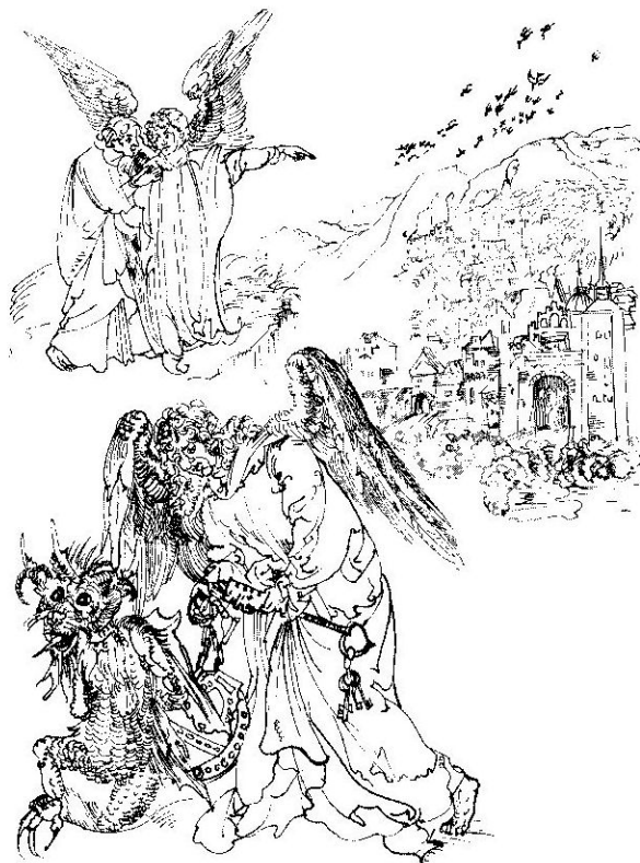
Archanděl Michael spoutává draka, vidění Nöbeského Jeruzaléma

berg a v Liber floridus Lamberta ze Saint-Omeru. Ve 13. století podstatně ovlivnila formování apokalyptických cyklů malířská škola ze St. Albanu v Anglii. Pozoruhodné nástěnné cykly Apokalypsy zdobí stěny kaple Všech svatých v ambitu dómu v Řezně (1150), opatského kostela ve Schwarzhendorf (13. stol.), františkánského kostela v Assisi (malby od Cimabue, konec 13. stol.). Apokalyptické motivy se stávají velmi aktuálními za velkého moru v Itálii v polovině 14. století. Síla morové epidemie byla taková, že to u mnohých lidí vyvolalo pocit, že jde o znamení konce světa. Mor v Itálii a snaha o spásu duše zřejmě motivovaly Karla IV. k tomu, že poručil namalovat apokalyptické cykly v kapli Panny Marie a v kapli sv. Křížce na Karlštejně.