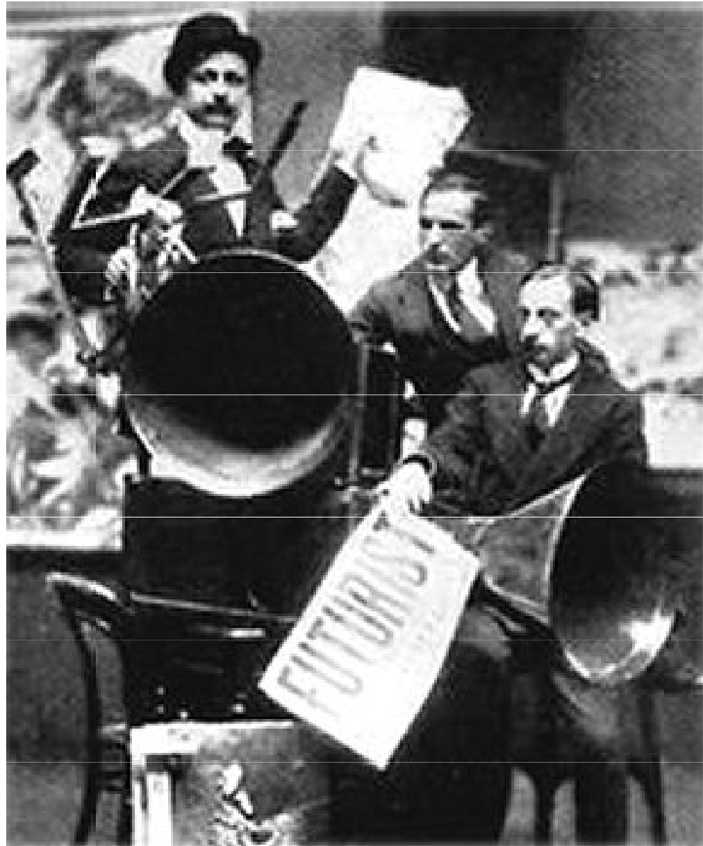
Marinetti, Russolo, Piatti – asi r. 1914