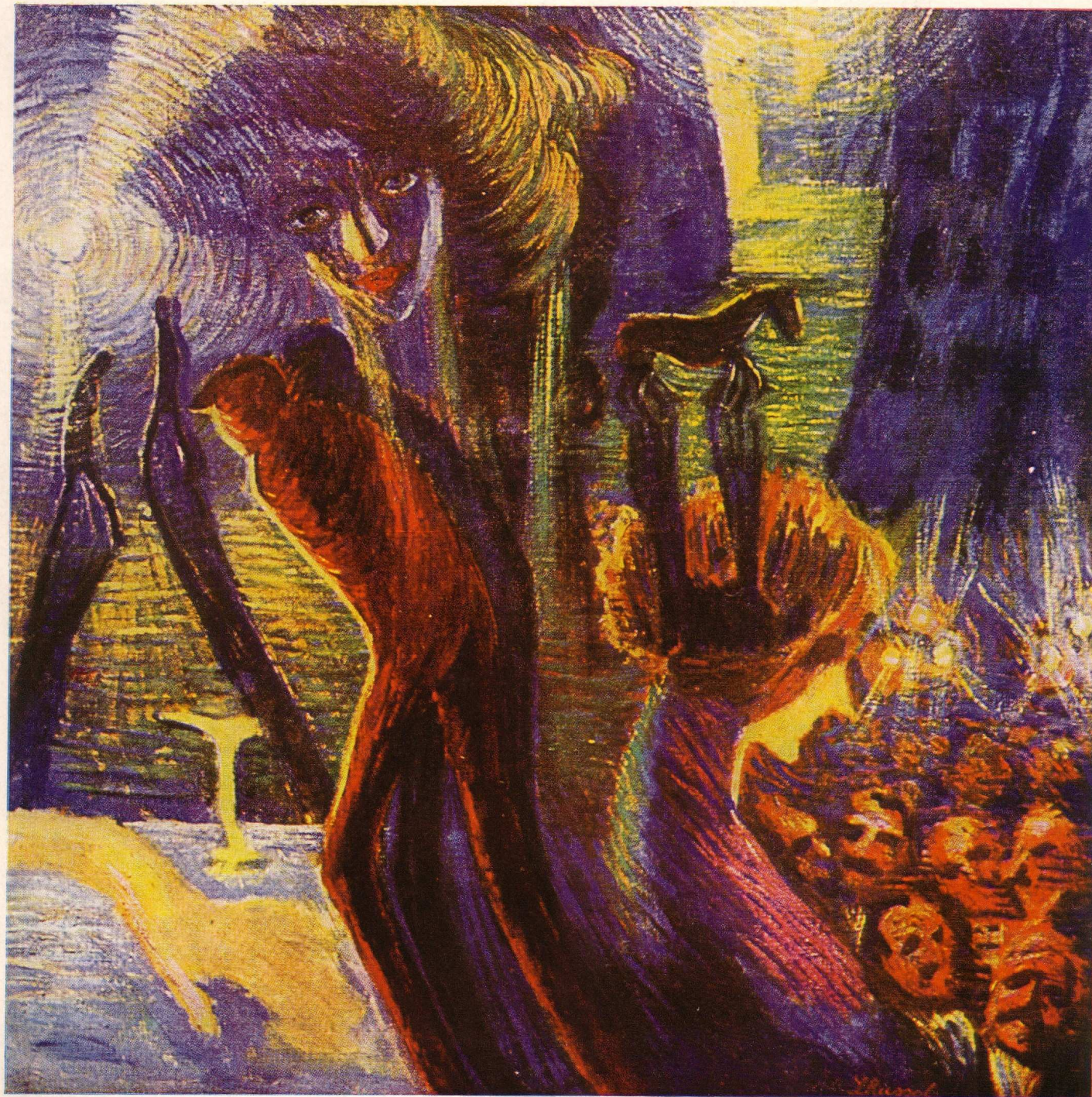
L. Russolo – Vzpomínka na jednu noc (1911)