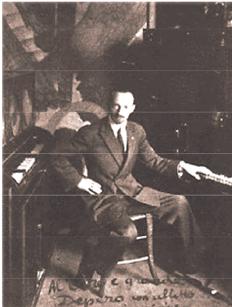
L. Russolo mezi dvěma Rumorarmonii, asi 1928