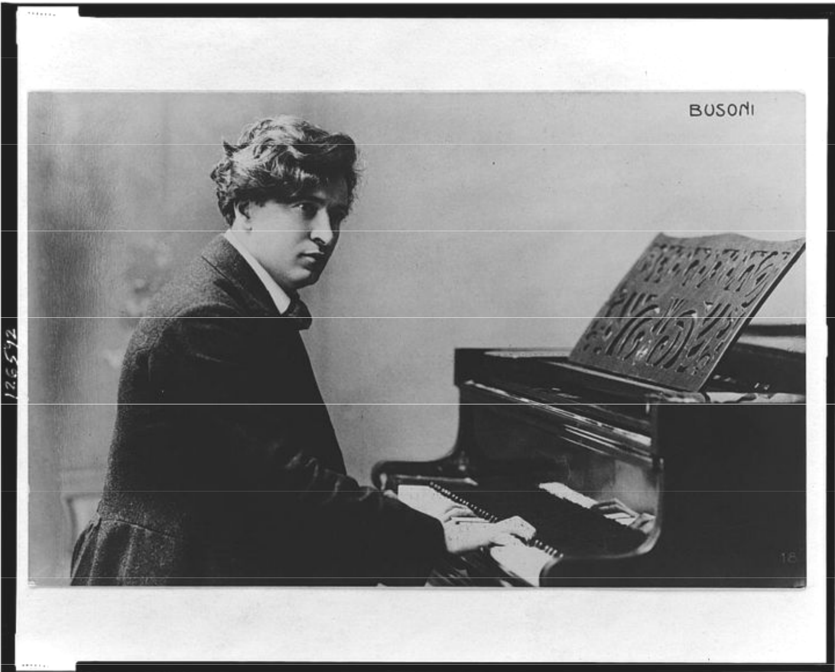
Feruccio Busoni (1866-1927)