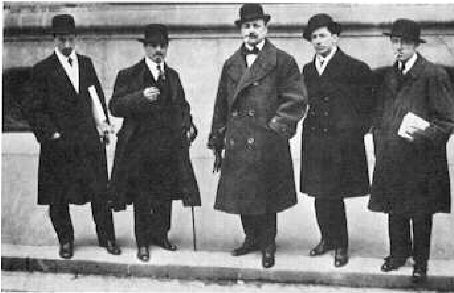
Luigi Russolo, Carlo Carra, F. T. Marinetti, Umberto Boccioni, Gino Severini (Paříž, 1912)