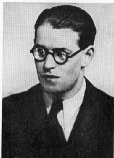
Josef Sulanský, člen El Carovy party – za okupace byl popraven nacisty