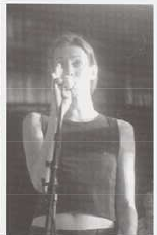
Scenes uit de film Slammers .