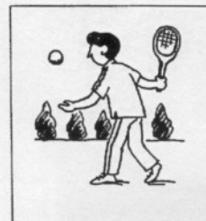
g ( )