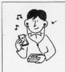
f ( )