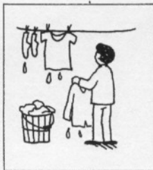
c ( )