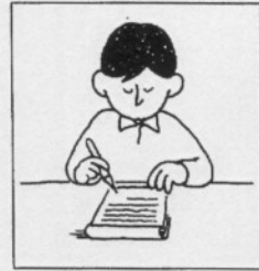
b ( )