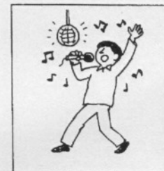
h ( )