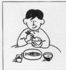
d ( )