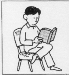
a ( )