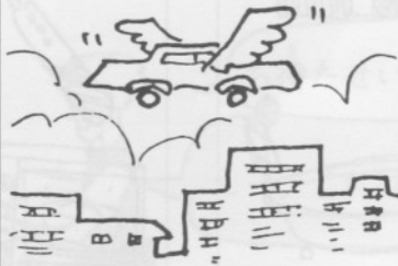
8. そら と くるま 空を飛ぶ車