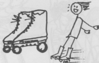
11. じどう 自動ローラースケート