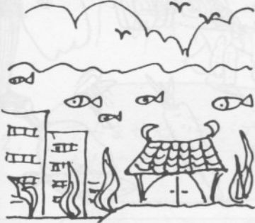
4. うみ なか いえ 海の中の家