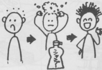
5. け は 毛の生えるシャンプー