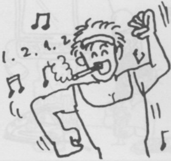
7. からだ 体にいいたばこ