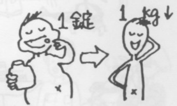
6. じょう 1錠で1キロ やせられる薬