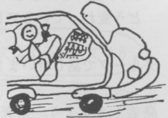
3. じどうそうじゅうしゃ 自動操縦車 (コンピューターカー)