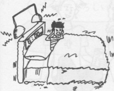
10. めぎ 目覚ましベッド