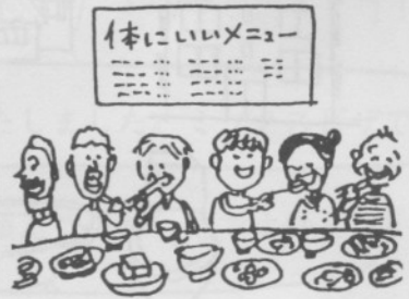
9. ろうじん しょうどう 老人のための食堂