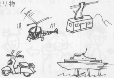
の 乗 り 物