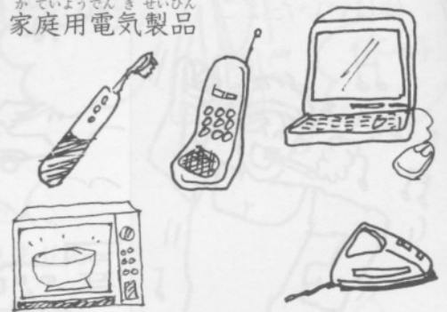
か て い よ う で ん き せ い ひ ん 家 庭 用 電 気 製 品