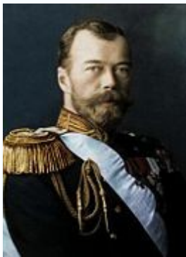
☞ Николай II (раскрашенная фотография)

1 августа 1914 года Германия объявила войну России. Началась Первая мировая война , которая привела страну к экономическому и политическому и кризису и двум революциям.