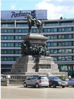
Паметник Царю Освободителю в Софии

В столице Болгарии , Софии , в центре города воздвигнут монумент Александру II в честь освобождения Болгарии от турецкого ига после русско-турецкой войны 1877—1878 г.