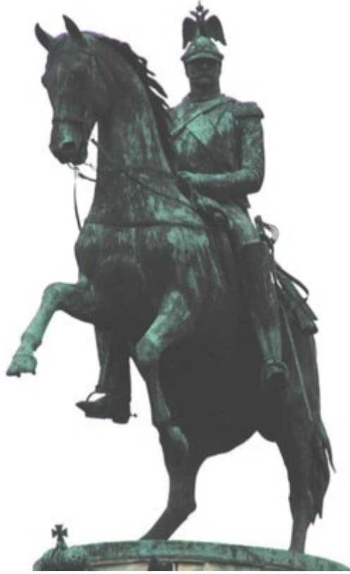
Памятник Николаю I в Санкт-Петербурге