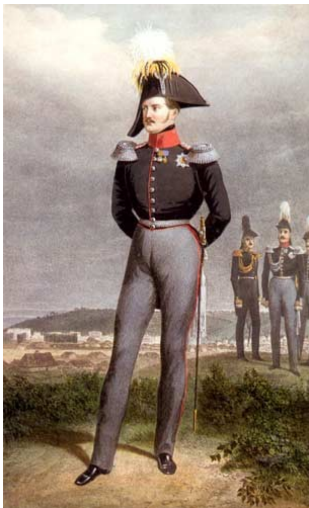
Император Николай I. Раскрашенная литография с оригинала Ф. Крюгера. 1835 (?).