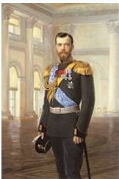
Портрет императора Николая II работы Эрнста Липгарта (1896 год)

Высокими темпами продолжалось строительство железных дорог, суммарная протяженность которых, составлявшая 44 тыс. км в 1898 году, к 1913 году превысила 70 тыс. километров. По суммарной протяженности железных дорог Россия превосходила любую другую европейскую страну и уступала только США, но отставание России в индустриальном отношении сохранялось и даже усилилось в первое десятилетие XX в. По показателям выпуска основных видов промышленной продукции на душу населения Россия в 1913 г. была соседкой Испании. Но Россия отставала по производительности труда в 3 раза от Франции, в 5 раз — от Великобритании, в 9 раз — от США. По объему внешней торговли в расчете на душу населения Россию превосходили Испания , Португалия , Турция .