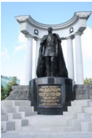
Памятник Александру II в Москве

В июне 2005 в Москве торжественно открыт памятник Александру II. Автор памятника — Александр Рукавишников .