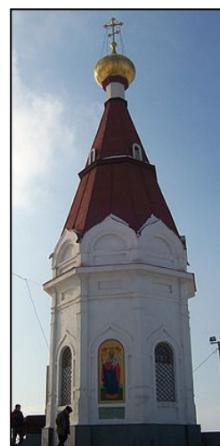
часовня на Караульной горе

Красноярск окружён горами, сопками, холмами, покрытыми тайгой, сосновыми борами. Юго-восточная часть Красноярска примыкает