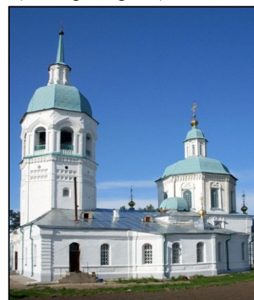
Спасо-Преображенский собор в Спасском монастыре Енисейска

ЕНИСЕЙСК расположен на Енисейской равнине, на левом берегу р. Енисей, ниже впадения в нее р. Ангара, в 39 км от железнодорожной станции Лесосибирск-I, в 338 км к северу от Красноярска. Речной порт. Аэропорт. Районный центр. Население 21,2 тыс. человек (2001). Основан в 1619. Город утратил свое административно-экономическое значение в связи с прокладкой Московско-Иркутского тракта, а затем Транссибирской железнодорожной магистрали. Упадок золотопромышленности и пожар, истребивший 3/4 города в 1869, нанесли городской торговле значительный ущерб. Сохранилась торговля пушным товаром, главным образом