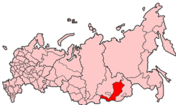
poloha Burjatska na asijském území