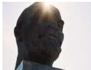
bronzová hlava Lenina