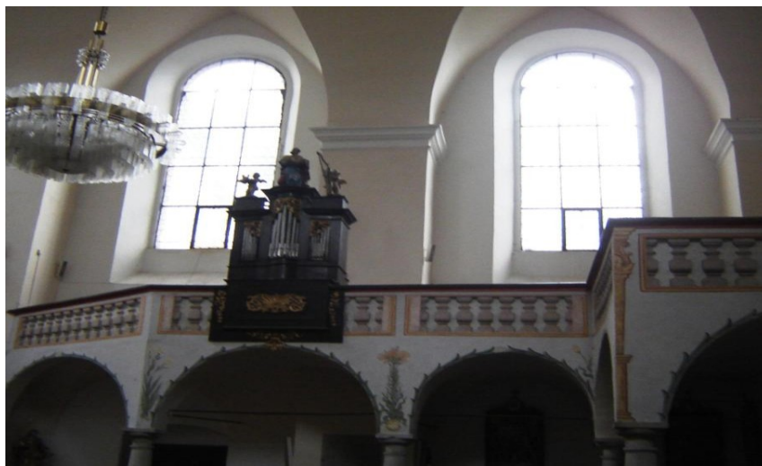
obr. 2. Literátský kůr děkanského chrámu Nanebevzetí Panny Marie v Havlíčkově Brodě