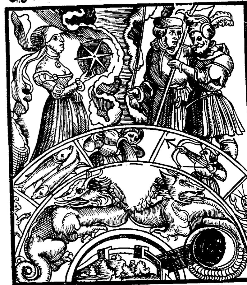
1/ Kolo štěstí