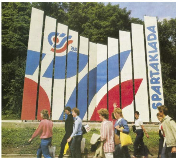
V čase spartakiády se strahovský stadion stal centrem cestovního ruchu

Především ale spartakiády odrážejí touhu komunistického režimu vytvořit novou socialistickou společnost a zformovat nového socialistického člověka. Disciplína či kázeň jsou nejen základními motivy, které spartakiády tematizují, ale také jejich základní stavební prvek. Jak ukázal Vladimír Macura, organizátoři spartakiád nechápali disciplínu jako ně-