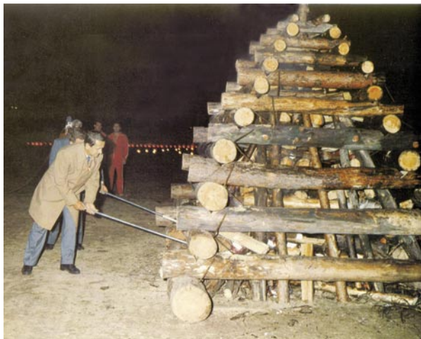
Momentky z poslední československé spartakiády v roce 1985: Gustáv Husák promlouvá před slavnostním zahájením ke cvičencům a předseda ústředního výboru ČSTV Antonín Himl zapaluje spartakiádní oheň

Přímý odpor představuje v typologii reakcí na spartakiádu relativně řídký jev. S nejvážnějšími potížemi, vedle vlažného postoje polské menšiny ve Slezsku, se organizátoři setkávali na Slovensku, kde se nechtěl ke komunistické tělovýchově mísila s nechutí k sokolské tradici čechoslovakismu a antiklerikalismu. Zpráva o přípravách okresních a krajských spartakiád na Slovensku z roku 1955 hovoří o případech žhářství, přestřihávání elektrického vedení, strhávání plakátů, v Galantě dokonce odlákali část cvičenců svátostí bířmování. Postupem času si však spartakiády na Slovensku získaly své stoupence a jejich zrušení v roce 1990 tam vyvolalo výrazně větší odpor než v českých zemích. Také v Praze se pokaždé spartakiáda setkala alespoň se symbolickými formami protestu, jako strhávání či naopak vylepování plakátů, docházelo i k pokusům narušit chod „sparta-