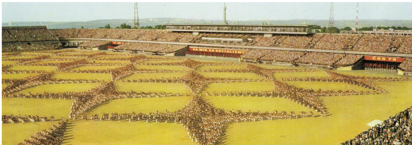
Úvod skladby Československé lidové armády na spartakiádě v roce 1975

jaký vnější princip, kterému by bylo potřeba obětovat přirozenost individuálního chování a pohybu, ale jako vnitřní podstatu člověka, zdeformovanou běžným životem a buržoazními přežitky. Marie Majerová, když hovoří o disciplíně cvičenců, jásá nad radostným vnitřním pocitem vítězství nad přírodou, při kterém ta upažená, podřepý, podpory ležmo za rukama, to jsou vsutku stylizovaná lidská konání, očistěná od nepěkných mimovolných návyků nekontrolovaných pohybů... Hlavní ideolog spartakiád Vilém Mucha dokonce usiloval o to, aby se disciplína spartakiádních cvičenců přenesla do běžného života: Vždyť se to konečně týká všech lidí, aby uměli dobře pochodovat, dobře se vyřizovat, „držet krok“ a zákryty v pochodu. Jiný z hlavních organizátorů Spartakiád (stejně jako sletu 1948 i sletů po roce 1989) Jiří Žižka doporučuje začít s výchovou ke kázni již od tří let; k transformaci člověka v disciplinovaného jedince již v předškolním věku má pomoci systém pořadových cvičení zahrnující jednoduché řazení, změny tvary, nástupy v určité tvary.