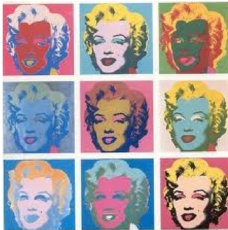
A. Warhol: Marilyn, 1964