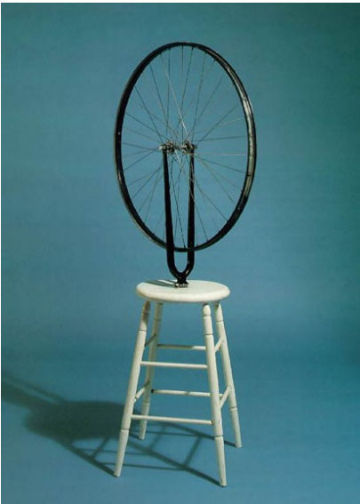
Bicycle Wheel, 1913, 1915