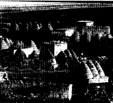
Ş. Urfa, Harran