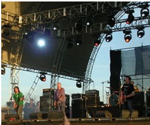
Actuación de Barricada en el Extremúsika 2006