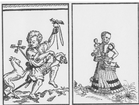
znázornění hrajících si dětí s typickými hračkami