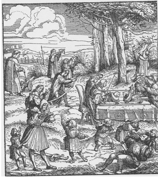
dobové vyobrazení hrajícího si mladého císaře Maximiliana I.