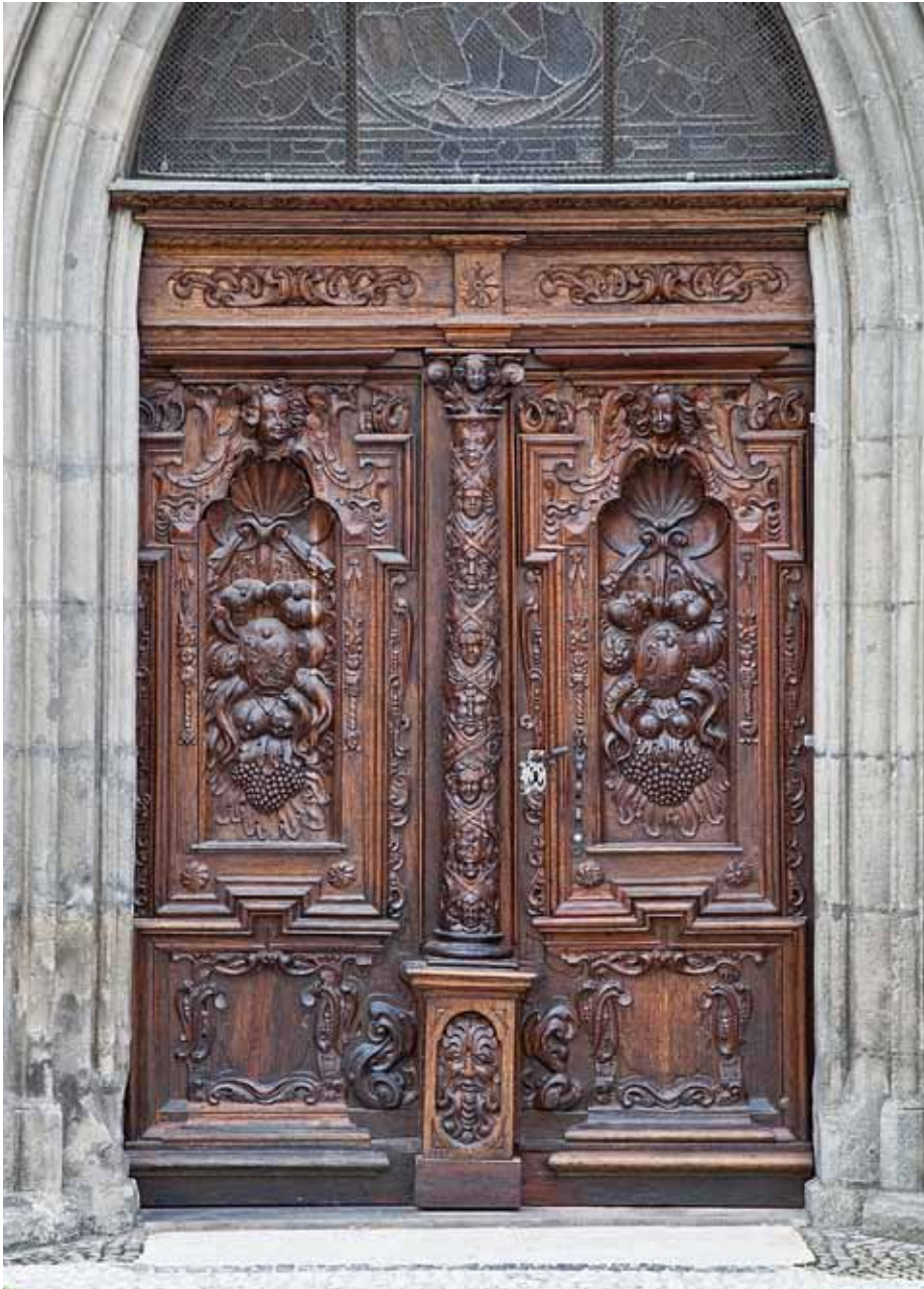
Portálové dveře hlavního vstupu do kostela sv. Kateřiny v Olomouci, třetí čtvrtina 17. století.