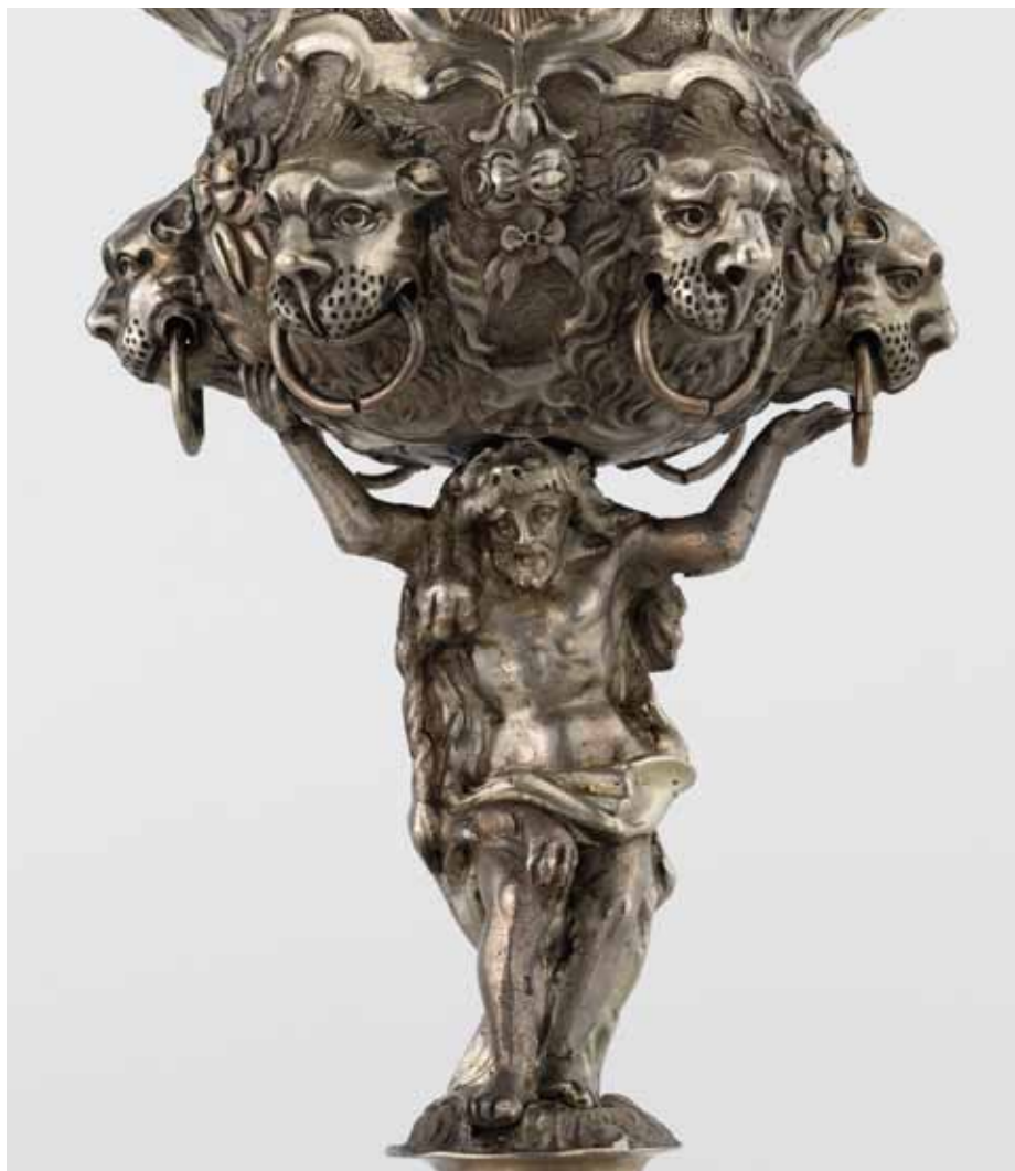
Sebastian Ignaz Franz Freund, Pohár cechu olomouckých pekařů, 1754, stříbro, částečně zlacené, detail. Vlastivědné muzeum v Olomouci.

Období 17. a 18. století bylo na Moravě dobou rozkvětu duchovní hudby. V sou-