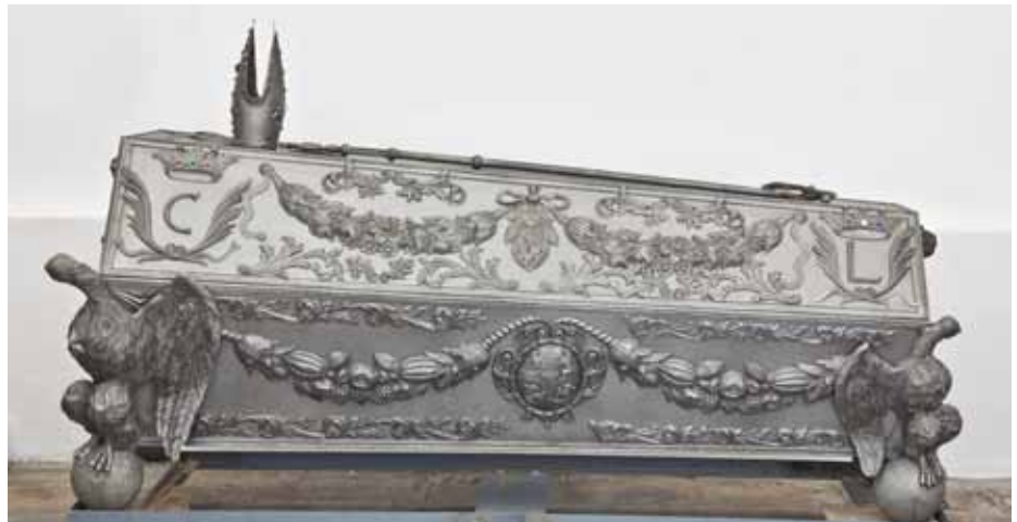
Johann Beer, Rakev olomouckého biskupa Karla II. z Lichtensteinu-Castelkorna, 1696, cín. Olomouc, katedrála sv. Václava.

Zlatnické řemeslo vždy patřilo v celé Evropě k nejuznávanějším a nejprogresivnějším oborům středověkého umění. Ovlivnila to samozřejmě i hodnota používaných materiálů, jejich cena a nedostupnost. Stejně tomu bylo i v Olomouci, kde jsou zlatníci ( Goldschmiede, Aurifabri ) v písemných pramenech doloženi již od roku 1268 zlatníkem Klausem, a pravidelně od roku 1357 zlatníkem Kuncem. V 15. století je možno ve městě napočítat již 26 zlatnických dílen, jejichž počet se v 16. století zdvojnásobil. V první polovině 15. století zlatníci vytvořili samostatný cech a k roku 1472 jsou ve městě doloženi ve společném cechu s malíři. Kolem roku 1536 se k nim připojili ještě perletáři ( Perlheber ) a od roku 1578 také sklenáři, zla-