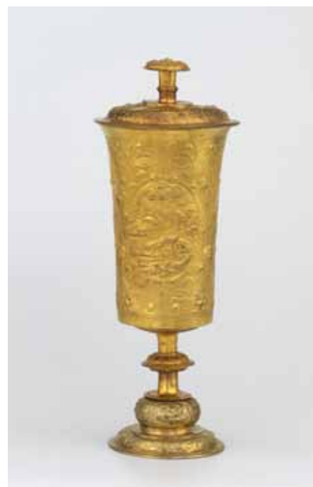
Olomoucký zlatník (?), Pohár s víkem, tepaná, cizelovaná a pozlacená měď, první polovina 17. století. Vlastivědné muzeum v Olomouci.

Olomoucký zlatník (?), Relikviář ve tvaru monstrance, zlacené stříbro, barevné sklo, kolem poloviny 18. století. Vlastivědné muzeum v Olomouci.