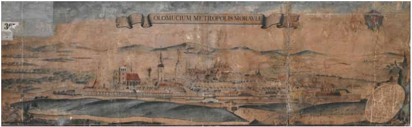
Celkový pohled na Olomouc od jihozápadu, 1761, kolorovaná kresba perem a tužkou. Státní okresní archiv Olomouc.