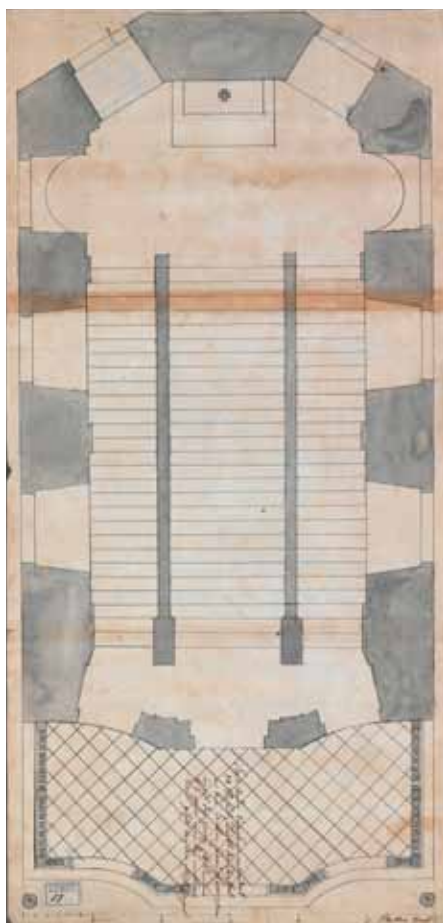
Neznámý architekt, Půdorys kostela svatých schodů v Olomouci při klášteře františkánů-observantů, 1702, kolorovaná kresba tužkou a perem. Státní okresní archiv Olomouc.