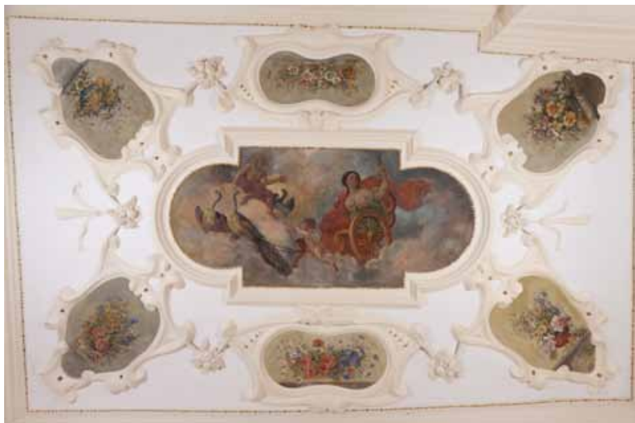
Pohled na štukový strop s freskou Juno na voze taženém pávy v piano nobile měšťanského domu na Horním náměstí 12, druhá polovina 18. století, doplňky na konci 19. století.