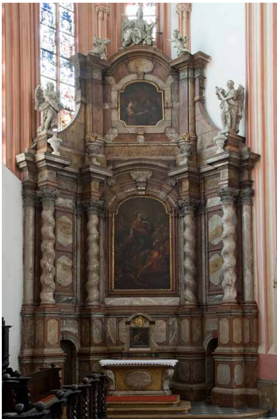
Václav Render - Filip Sattler, Oltář sv. Pavlína v chrámu sv. Mořice, 1719.