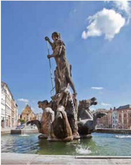
Michael Mandík, Socha Neptuna z kašny na Dolním náměstí, 1683, pískovec.

města sv. Pavlíny konaná u jezuitů a spojená s procesím po městě a studentským divadlem, i konání procesí na svátek Božího Těla. Obou slavností se měšťané zúčastňovali nejen jako diváci, ale jako přímí aktéři, protože většina z nich byla členy řemeslnických cechů, jejichž účast v procesí byla povinná. Významnými měšťanskými – řemeslnickými slavnostmi byly i veškeré cechovní schůze, prohlášení tovaryšů na mistry, stěhování cechovní pokladnice a pohřby členů cechů. Vzhledem k tomu, že do městské rady byli voleni jen měšťané, zaujalo jejich pozornost i její každoroční slavnostní obnovování na svátek sv. Vavřínce. Měšťané velmi rádi sledovali i slavnostní průvod, v němž byly převáženy moravské zemské desky z radnice nebo z krypty kostela sv. Václava do místa zasedání zemského sněmu v sousedství kláštera dominikánů na Michalském návrší, aby do nich mohly být provedeny příslušné zápisy. Kromě toho byli obyvatelé města svědky také příležitostných oslav konaných u příležitosti návštěv panovníků a dalších významných osobností, dále pak oslav válečných vítězství, oslav narození a narozenin dědiců trůnu a v neposlední řadě i vykonávání občasných exekucí provinilých a poprav odsouzených zločinců, což představovalo pro většinu diváků velké divadlo. Městskými katy byli: v roce 1651 Jiří Pečínka, 1656 Eliáš Wildner, 1684 Kristián Windt, 1697 Jan Michal Pietsch, 1736 Jan Kašpar Pietsch, 1743 František Ignác Pietsch, 1751 Ferdinand Reitknecht, 1764 Karel Josef Grimm, 1770 Ferdinand Grimm atd.