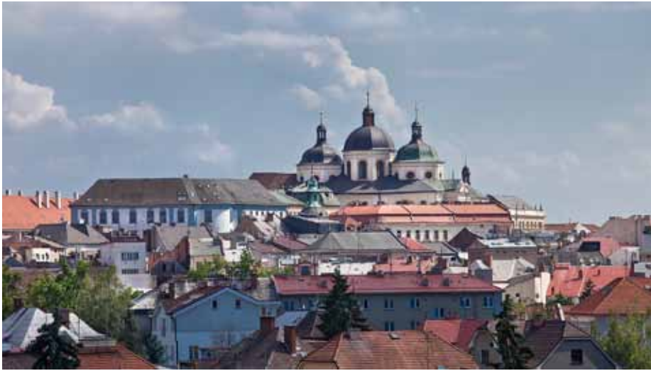
Pohled na Olomouc s dominantami bývalého dominikánského kostela sv. Michala a jezuitského semináře sv. Františka Xaverského, pohled od severu.

Do nich byl uváděn vždy nejmladším radním, jenž mu byl povinen při jeho odchodu otevřít dveře. Změny ve správě města nastaly až v roce 1726, kdy byl zrušen dosavadní systém čtyř konšelů, kteří se do té doby každého čtvrt roku střídali ve funkci purkmistra, a vznikl tzv. Magistrát, jež tvořilo dvanáct, doživotně jmenovaných radních, včetně purkmistra, vesměs lidí již s právnickým vzděláním. Poradním orgánem rady byla přežívající tzv. vnější rada, složená ze zástupců nejváženějších měšťanů, která však již nebyla doplňována, a proto v důsledku postupných úmrtí svých členů koncem první poloviny 18. století zanikla.