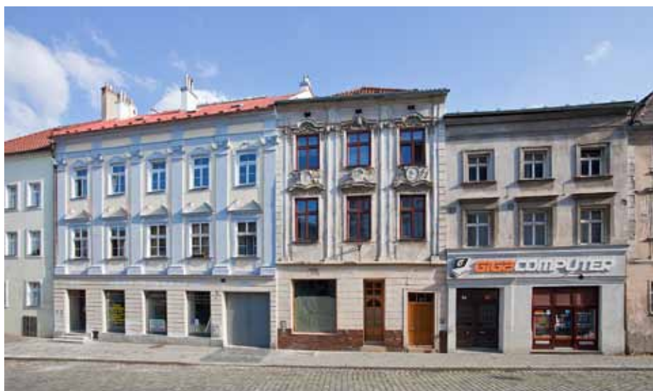
Pohled na uliční frontu domů v ulici 1. máje v Olomouci s fasádami z 18. století.