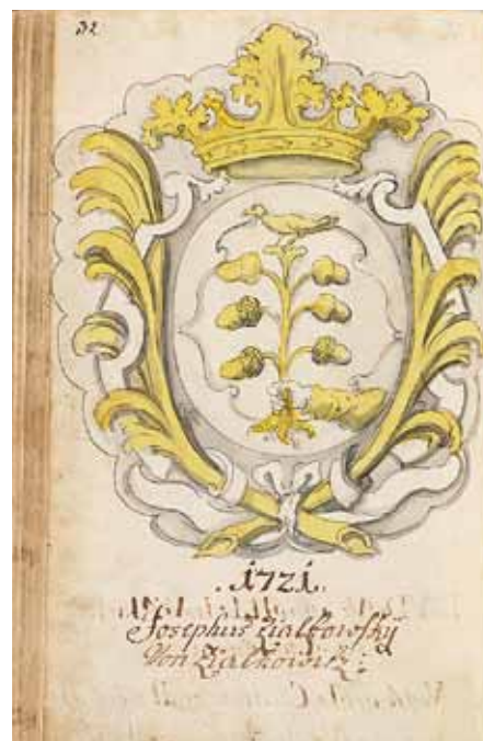
Filip Sattler (?), Střelecké štitky v Pamětní knize střeleckého bratrstva Olomouci ( Gedenkbuch der bürgerlichen Scheiben-Schützen-Bruderschaft der königlichen Hauptstadt Olmütz ), kolem 1735, kolorované a lavírované perokresby. Vlastivědné muzeum Olomouci.

Jaká tedy byla kultura olomouckých měšťanů v období baroka? Není pochyb o tom, že se její úroveň souběžně s konsolidací města a s rozvojem řemeslnického