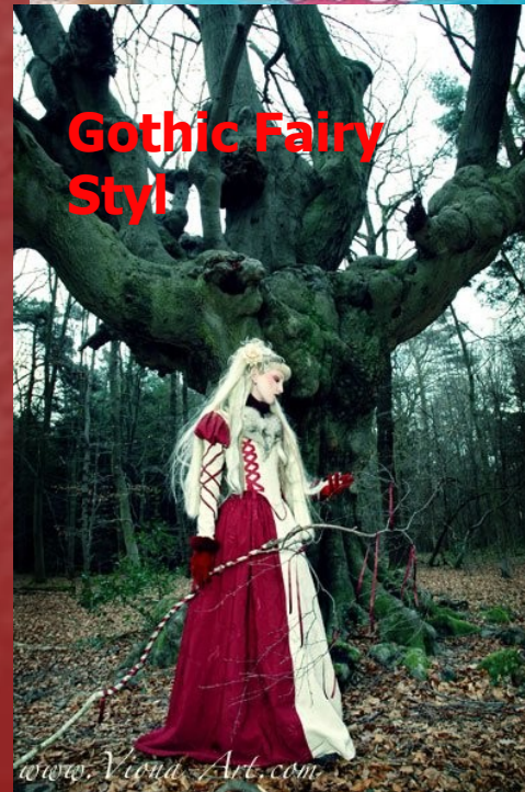
Gothic Fairy Styl