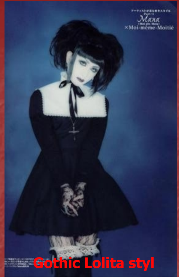
Gothic Lolita styl