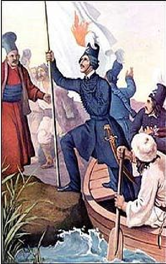
Ypsilantis na řece Prut