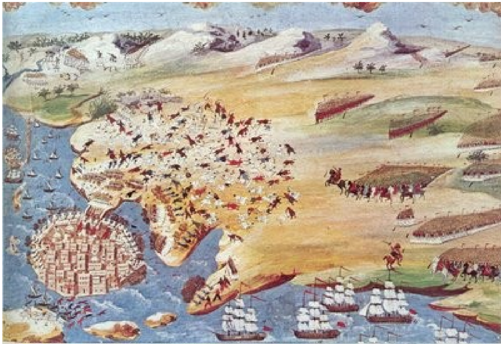
Obléhání Mesolongi, 1827