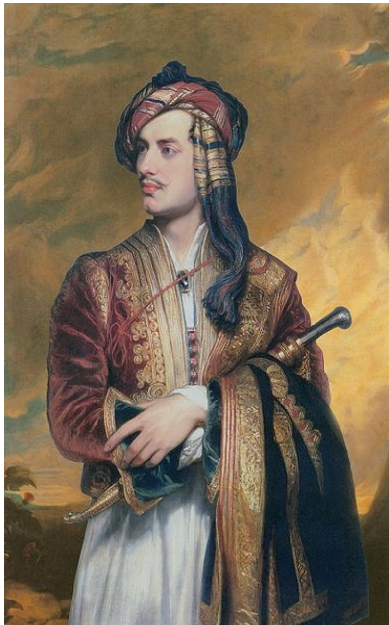
Lord Byron v balkánské ústroji