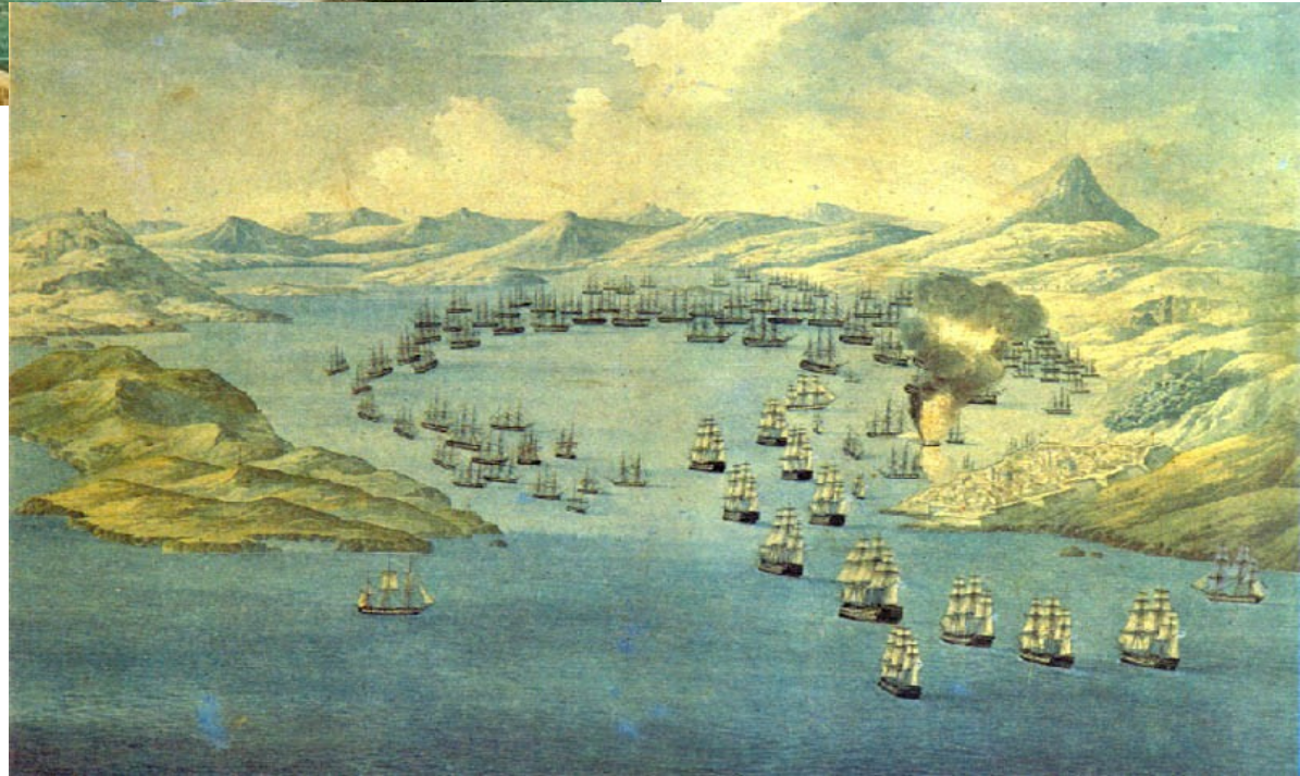
Bitva u Navarina, 1827