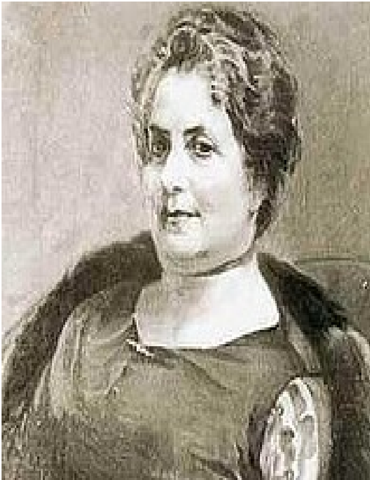
Kalliroi Parren , průkopnice řeckého feminismu