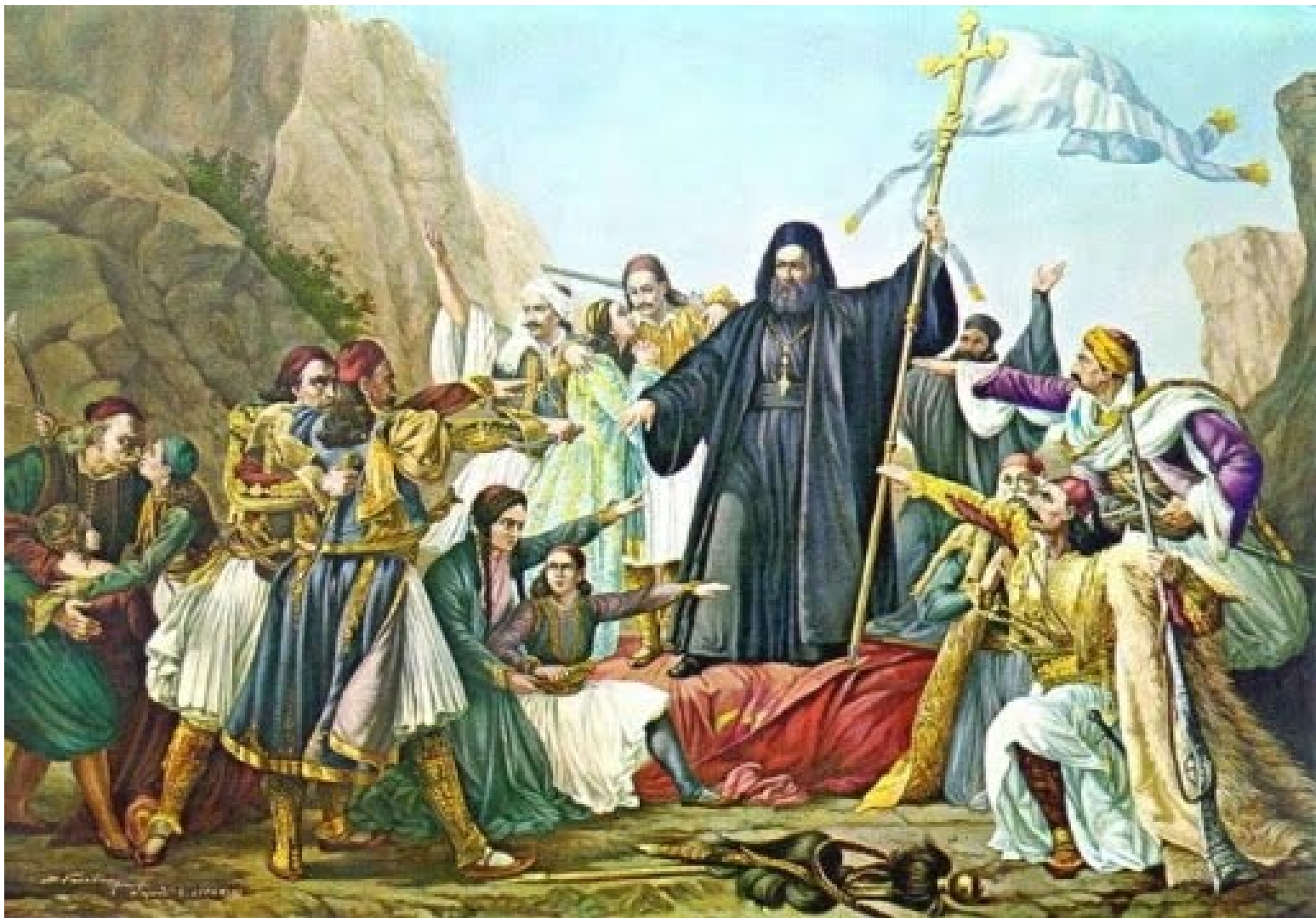
Zidealizovaná představa o vypuknutí povstání 1821, uprostřed metropolita města Patra arcibiskup Germanos