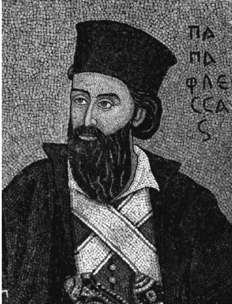
Bojující kněz – Papaflessas padl 20.5.1825 v bitvě u Maniaki