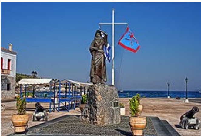
Socha Laskariny Bubuliny na Spetses