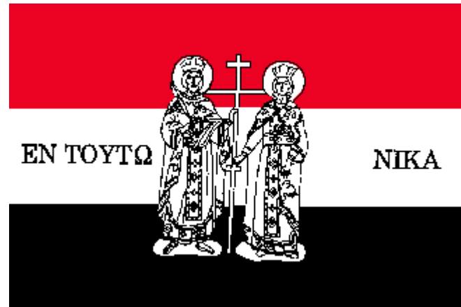
Prapor Svaté Legie