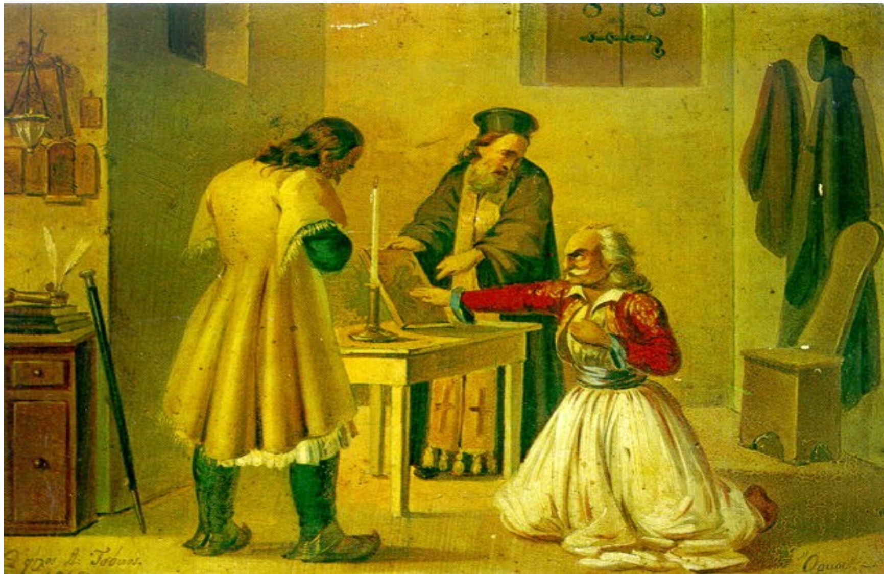
Přísaha nového člena Filiki eteria