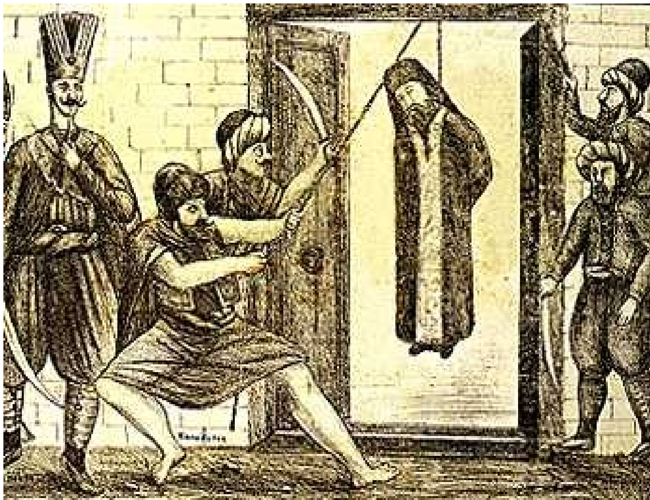
Oběšení ekumenického patriarchy Grigorije V. poté, co vypuklo povstání na Peloponésu