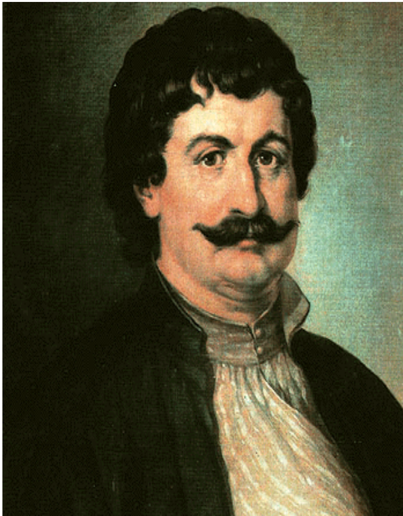
Rigas Velestinlis (Fereos)