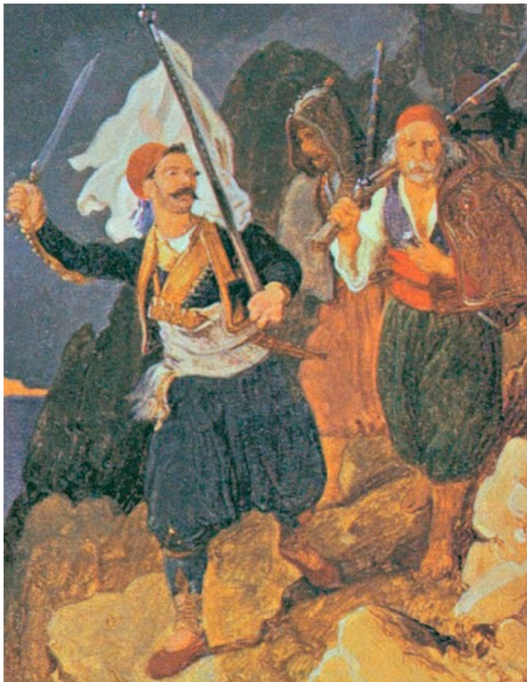
Výjevy z bitev