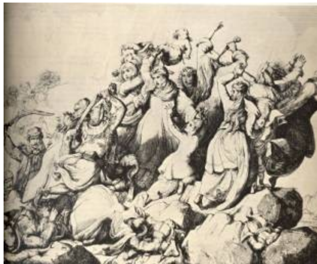
Suliotské ženy se vrhají s dětmi v náručí do propasti