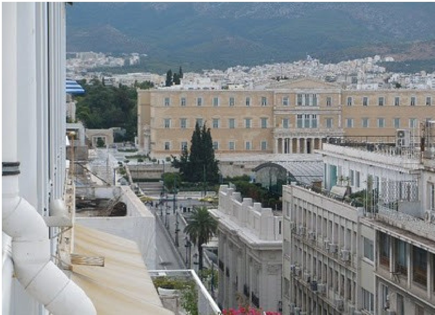
Královský palác – postaven 1836, sídlo Otty Bavorského a Jiřího I. , od roku 1929 sídlo parlamentu