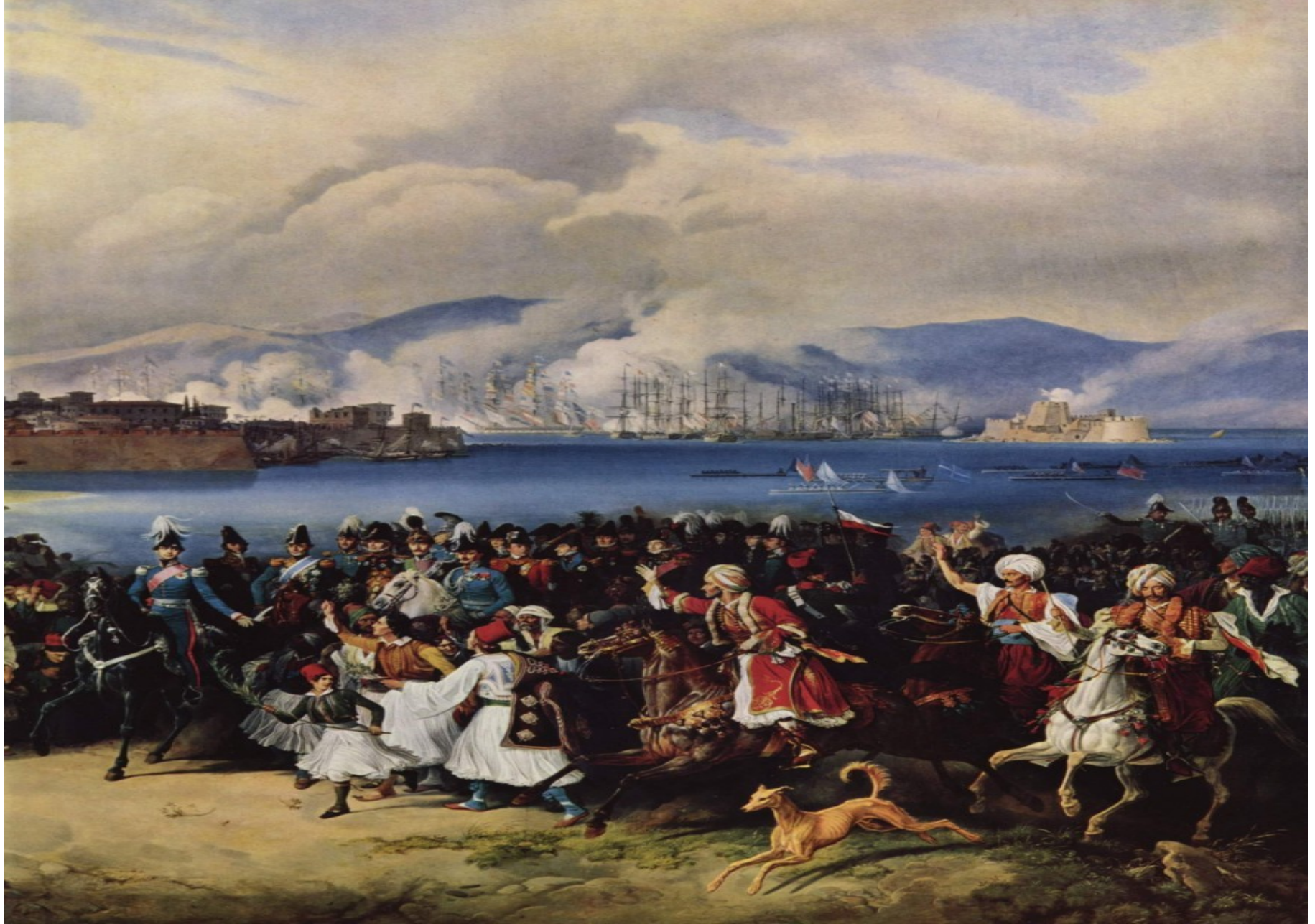
Příjezd Otty do Nafplia, 1833