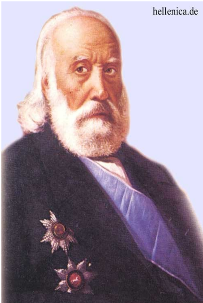
Konstantinos Kanaris, námořní kapitán z povstání 1821, po vzniku státu zůstal v politice, premiérem 1848, 1864, 1876