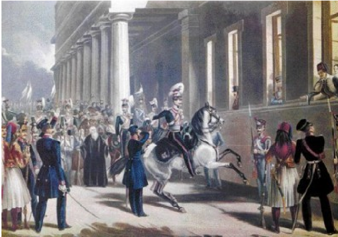
Plk. Kallergis na koni promlouvá k Ottovi a Amálii, 1843