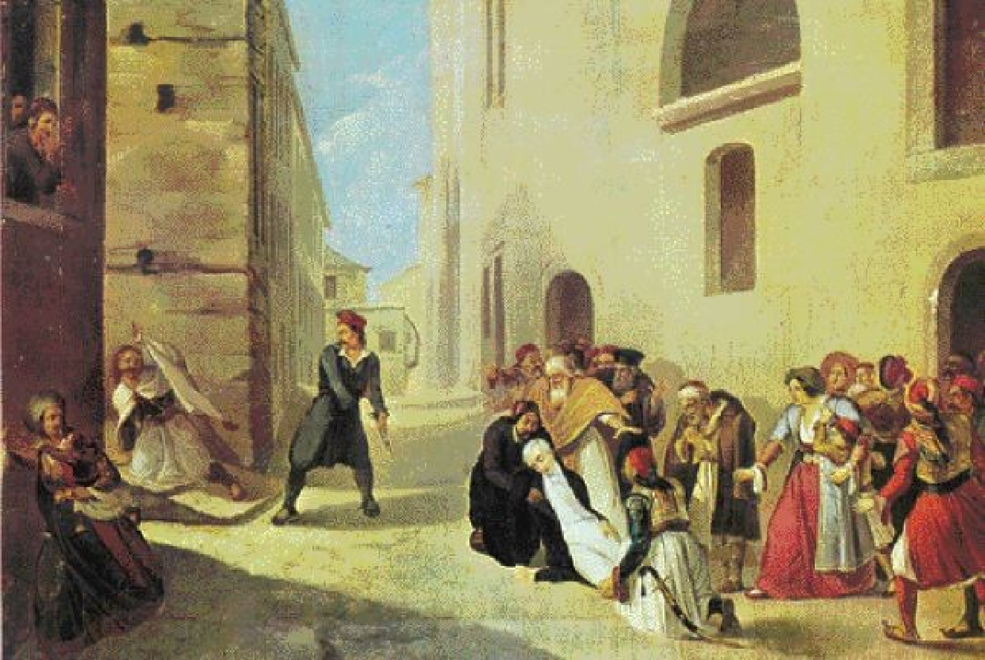
Zavraždění Kapodistriase v Nafliu, 1831