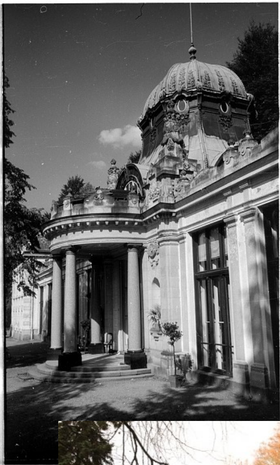
Ottův pramen, lázně Kyselka