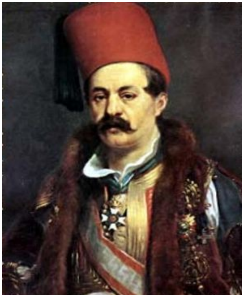
Ioannis Kolletis , vůdce francouzské strany, lékař Ali paši Janinnského a ideový tvůrce Velké Myšlenky