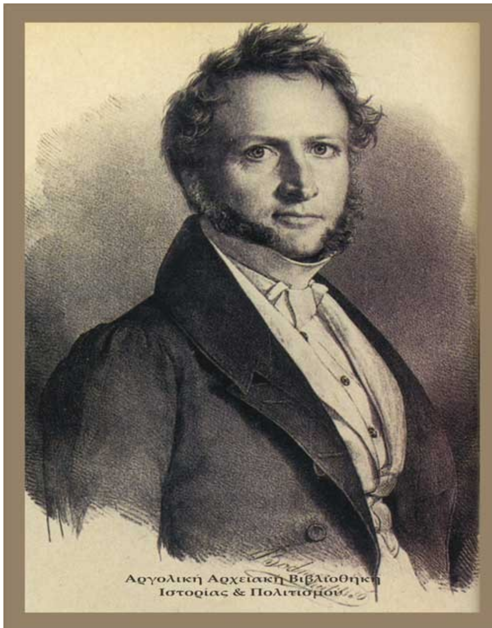
Ludwig von Maurer