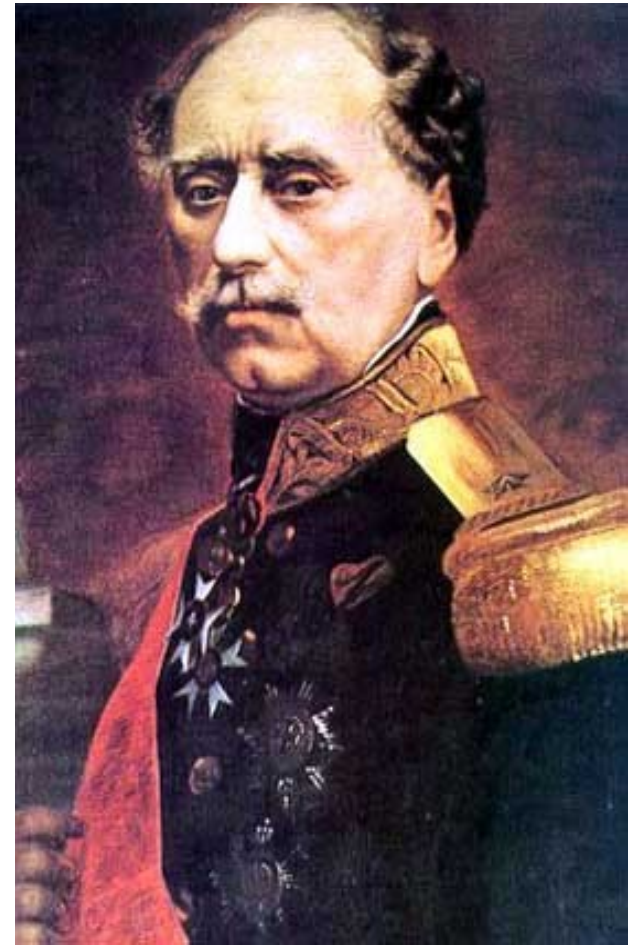
Plk. Dimitrios Kallergis , vůdce „povstání 3. září“ (povstání „Zito syntagma“)