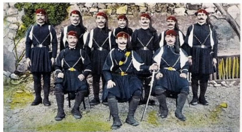
Četníci ze Samosu