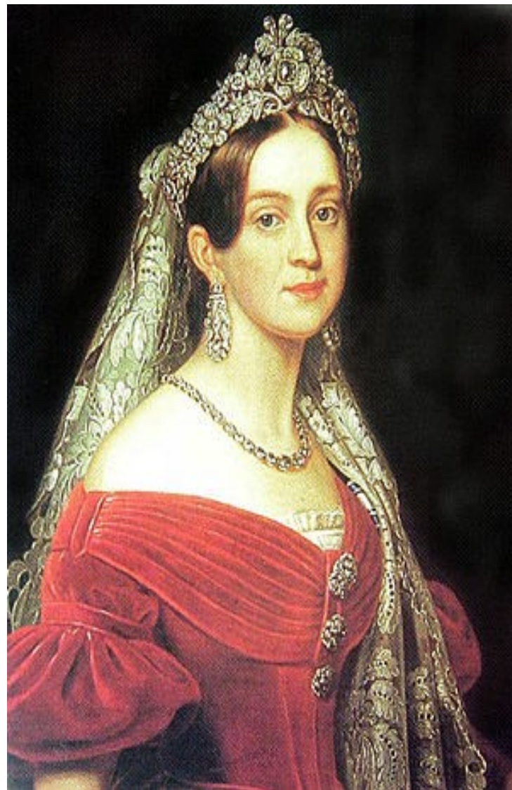
Královský pár Otto I. Wittelsbach (Bavorský) a Amalia