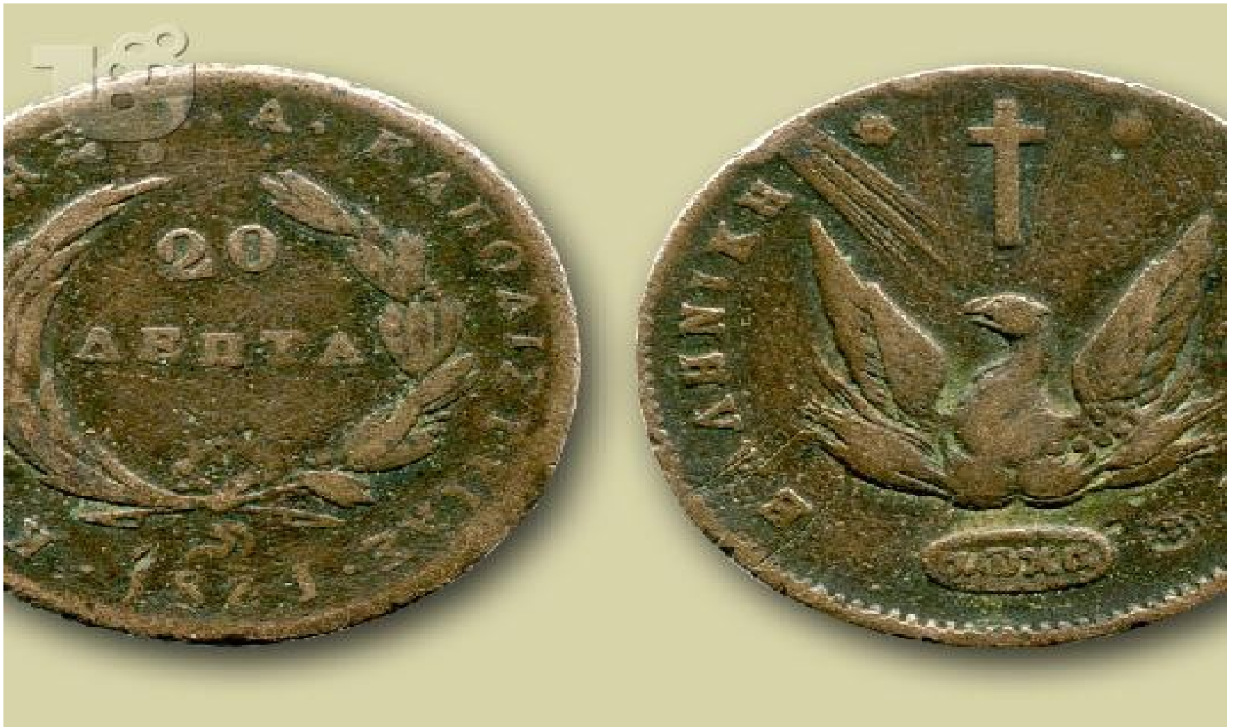
Řecká měna – stříbrný foinikas, od 1933 drachma