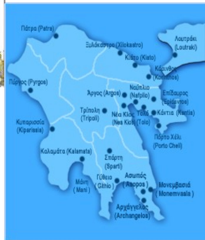
Nafplio, 1. hlavní město Řecka, 1828-1833