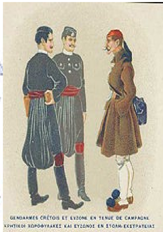
Četníci z Kréty