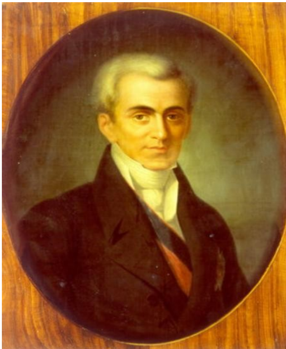
Ioannis Kapodistrias 1776-1831 „vladař“ v letech 1827-31