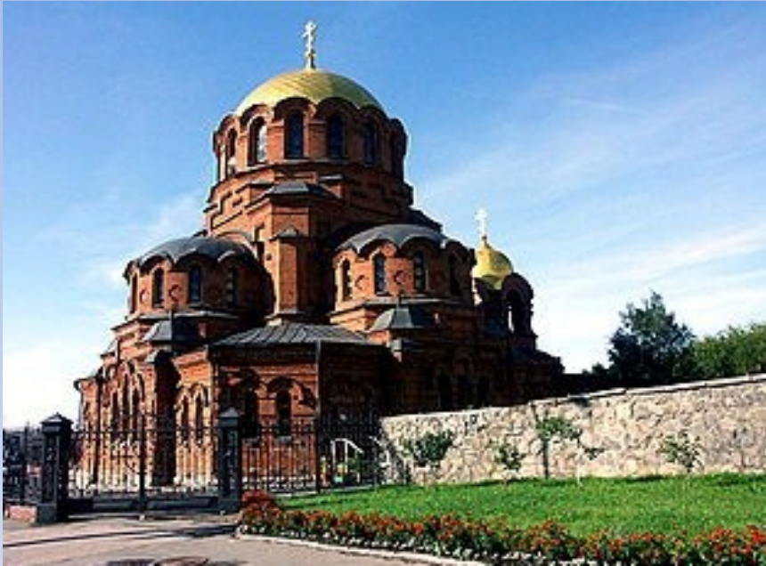
Собор Александра Невского