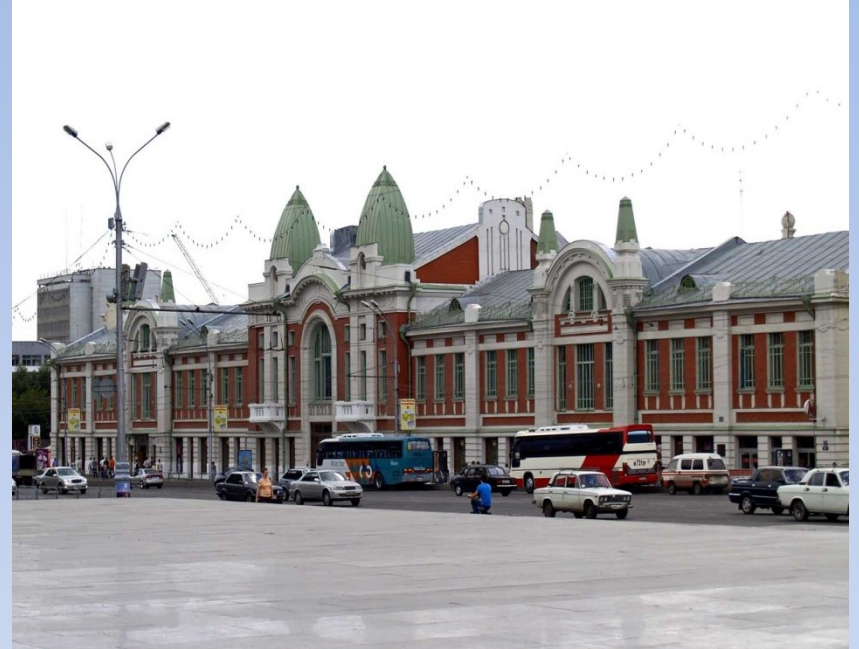
Городской торговый корпус