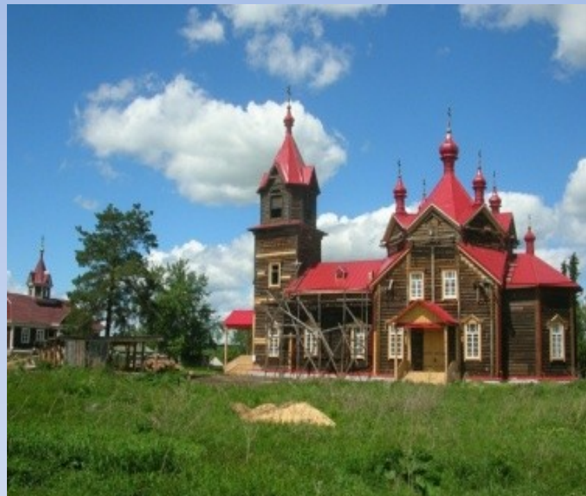
Церковь во имя Преподобного Серафима Саровского