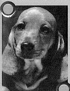
Немачки краткодлаки јазавичар

Мане: Потребно га је четкати после сваког извођења у шетњу. Тешко подноси самоћу те га препоручујемо породицама без деце.