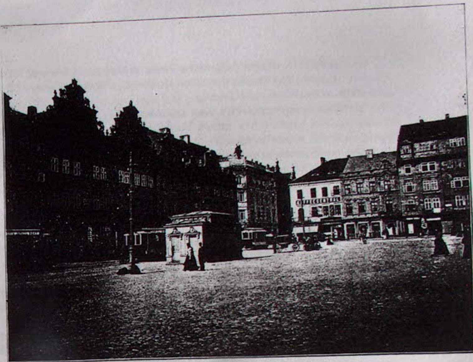
Obr. 4 — Plzeň — Severní strana náměstí.