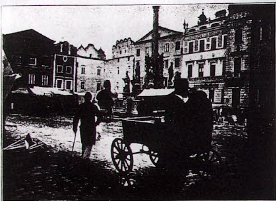
Obr. 3 — Pardubice — Náměstí.

Na českém venkově najdeme spíše ještě zbytky rázu našich starých náměstí, ač i zde nové stavby téměř v každém případě jej porušují.