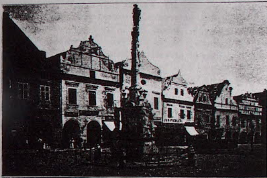
Obr. 8 — Treboň — Náměstí.

Že naše památky, klima, kultura a j. měly na vlašské mistry značný vliv, jest nepopíratelné; z toho vzájemného křížení kultur vyvinula se ve vlasti naší, právě tak jako v Němcích, Francii, Belgii, Nizozemí a Polsku, rázovitá odruda slohu renaissančního , která sice má společné známky