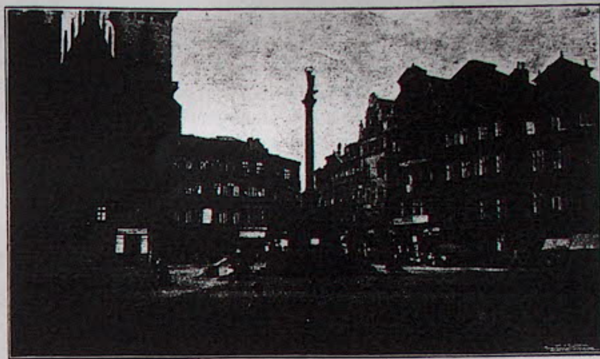
Obr. 1 — Praha — Staroměstské nám. — Východní a jižní fronta.

Žlaby vyčnívaly do náměstí neb ulic, a voda z nich padala volně;