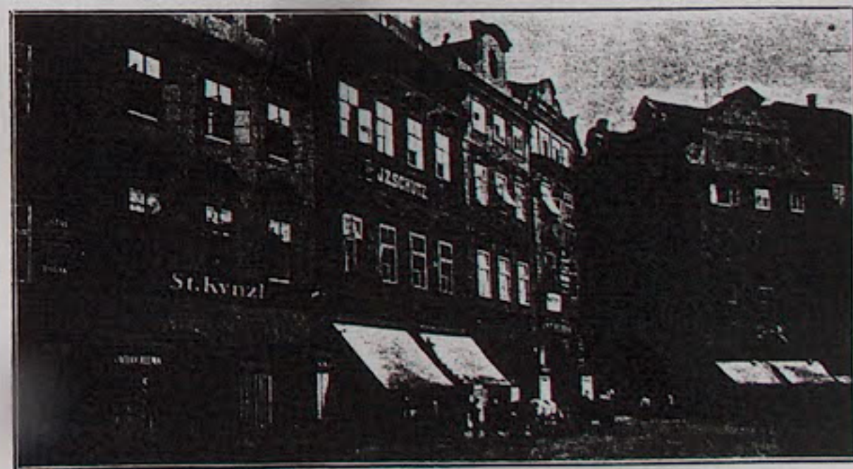
Obr. 2 — Praha — Staroměstské nám. s vyústěním Melantrichovy ulice.

teprve později sváděna troubami dolů, kde při chodníku vytékala. Výtoky žlabové byly mnohdy umělecky řešeny; na př. chrliče, tepané z měděného plechu, na pražském Belvederu a v Lounech na domě č. 57.