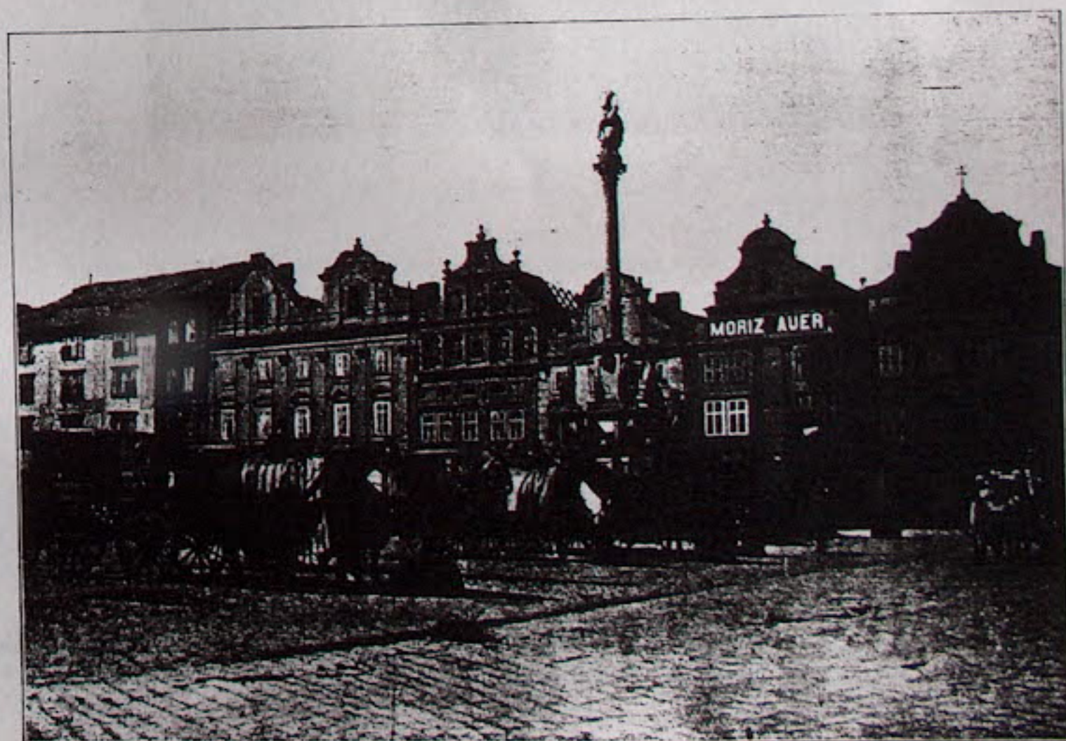
Obr. 5 — Plzeň — Východní strana náměstí.