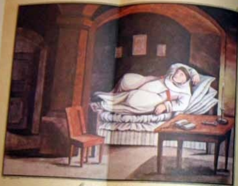
Wspaniały obraz z 1748 r. przedstawiający króla w łóżku.