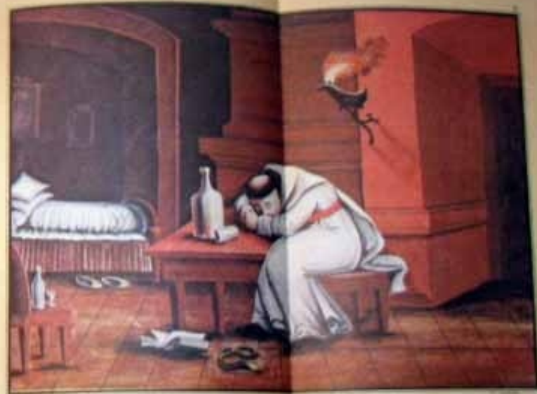
Wspaniały obraz z 1748 r. przedstawiający króla przy stole.