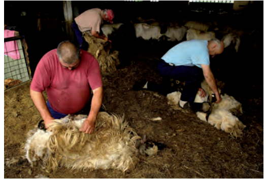
Ardiei ilea mozten / Esquilando ovejas / Shearing sheep.

Animals are a major source for games and metaphors in traditional culture. How a society deals with animals is revelatory of a cultural worldview. In many of the world's cultures, the definition of humanity is in opposition to animality. The millennia-old activity of hunting, and more recently animal husbandry, both underscore the singular relevance of animals in the human experience.