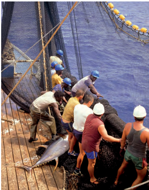
Atunaren arrantza / Pesca del atún / Tuna fishing.

zioarteko merkataritza-sareetan erabat murgilduta zegoela Erdi Aroan. Itsasgizon gazte batek lan egin zezakeen Espainiako edo atzerriko itsas enpresetako barkuetan edota sar zitekeen marinela itsas armadan erregearen zerbitzura. Arrantzalea bazen, berriz, herriko arrantzale-kofradiako kide izango zen, eta seguruenik Ternuako kanpainetan ere partu hartuko zuen. Herrian zegoenean, egunero aterako zen arrantzara, eta harrapatutako arrainak saldu egingo zituen, etxerako behar zituenak apartatu ondoren; arrainak Iruñera eta Madrilera bidaliko ziren gero, eta baita urrutirago ere.