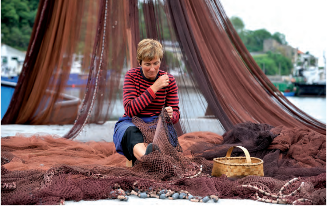
Emakumea arrantza-sarea konpontzen / Una mujer repara la red de pesca / Woman repairing fishing net.

bizimodura egokitzeko, eta beren seme-alabak ia aita ikusi gabe hazten dira, haren eredurik eta eraginik jaso gabe kasik. Baina arrantzaleak ezin du bizi itsasorik gabe, sarerik gabe, zoriarekin tirabira liluragarrian jolasean ibili gabe. Kontraesan etengabean bizi da: itsasoan dagoenean, etxea dauka gogoan, eta etxean dagoenean, itsasoa buruan. Horrenbestez, dagoen tokian dagoela, urrun sentitzen da beti; burua nahastua sentitzen du eta alienazioa ere paira dezake. Atzerriko portu batean marinelak moral sexual bikoitza erakuts dezake: bere iritzira, ez da onartzekoa inola ere emazteak beste gizon batekin amodio-harremanik izatea, bera itsasoan dagoen bitartean; baina "ulergarria" da bera prostituzio-etxeetara joatea, etxetik urrun dagoenean. Moral bikoitz horren arabera, prostituta batekin joateak sexu beharrak asetzea beste helbururik ez du, hor ez dago bestelako inplikaziorik, eta ez dauka zerikusirik harremanekin eta afektuekin. Era berean, bereizi egiten da fideltasun eza atzerriko portu batean eta etxean; lehenengoa barkagarria da; bigarrena ez.