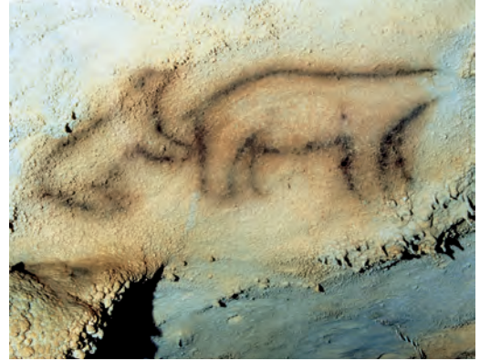
Ekaingo kobazuloko margoak / Pinturas de la cueva de Ekain / Paintings of the cave of Ekain.