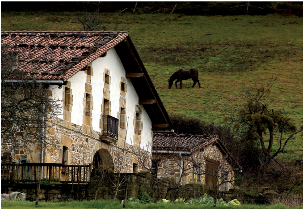
Baserría / Un caserío / A baserri farmstead.

berezia edukitzen da auzorik hurrenarekin, “lehen auzoa”rekin (ondoko baserrikoekin, alegia)–, hurbilen dauden hiruzpalau etxeekin eta auzoko beste baserri guztiekin. Ohitura zaharrear, etxe bakoitzak lehen auzoaren beharra zeukan premiazko obligazio eta eginbeharretarako; larrialdietarako, adibidez. Ez-beharren bat sortzen zenean, lehen auzoari ematen zitzaion, kanpoko beste inori baino lehen, berria. Etxean norbait hiltzen zenean, lehen auzoak ematen zien heriotzaren berri apaizari eta agintari zibilei; bera arduratzen zen hiletaz eta zerraldoaz, eta bera jartzen zen harremanetan hildakoaren familiako senideekin. Aurreneko dolu-egunetan, lehen auzoak bere gain hartzen zituen zendutakoaren baserriko lanak. Lehen auzoarekin edo auzo hurkoarekin harremanen garrantzia esaera zaharretan eta atsotitzetan ere jasotzen da; batzuetan senideen aurretik ere