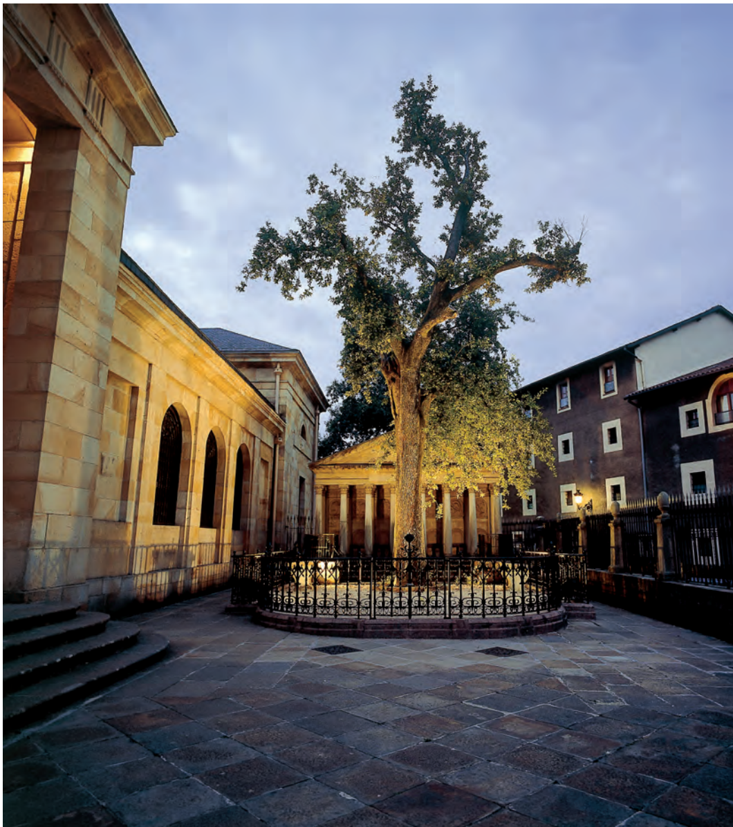
Gernikako arbola / Árbol de Gernika / The tree of Gernika.