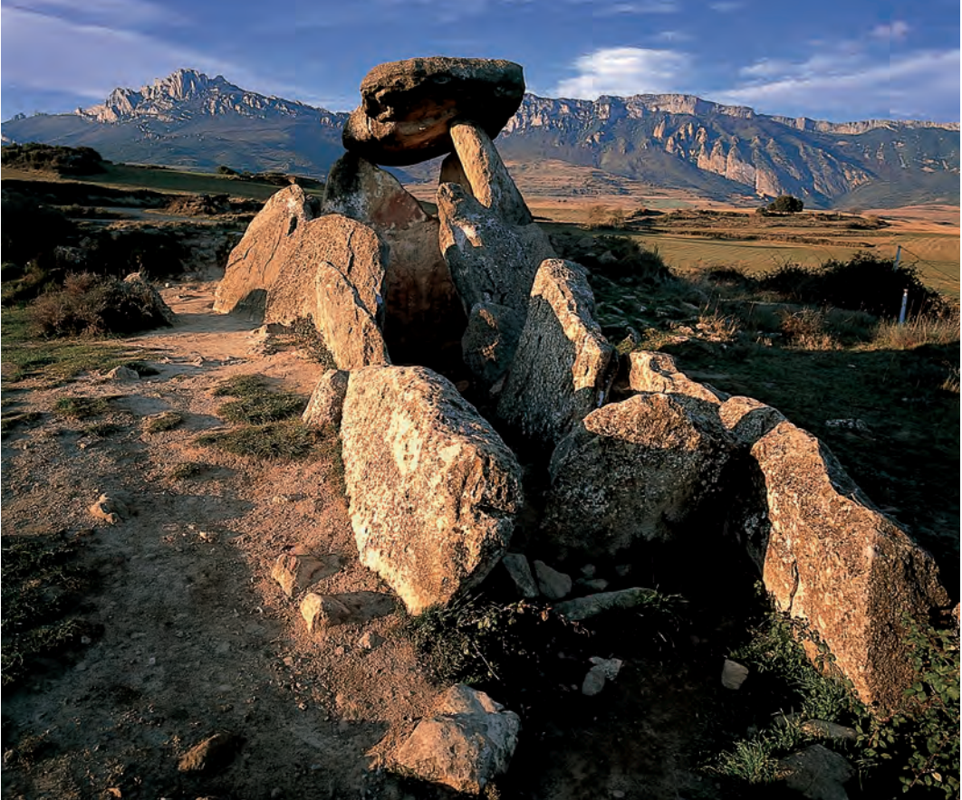
Trikuharri bat, Euskal Herriko mendietan / Uno de los dólmenes que se encuentran en los montes del País Vasco / A dolmen in the mountains of the Basque Country.

gigarria”, hau da, objektuetan egiten zena. Adituek historiaurreko artea estiloen, materialen, gaien, tekniken eta asoziazioen arabera sailkatzen dute. Motiboen artean, animalia eta gizakien irudiak daude eta baita interpretatzeko zailak edo ezinezkoak diren diseinuak ere. Labar-artean, honako animalia hauen irudiak agertzen dira hormetan pintatuta: oreinak, zaldiak, bisontek, arrainak, ahuntzak, hartzak eta txoriak. Haitzuloetako pinturek espekulazio akademikorako bidea eman dute askotan. Irudi ez-figuratiboen artean, badira forma simple luzexkakoak; forma linealekoak, haginez apainduak; V formakoak; izar edo X itxurakoak; arku formakoak; lerro zuzenez osa-