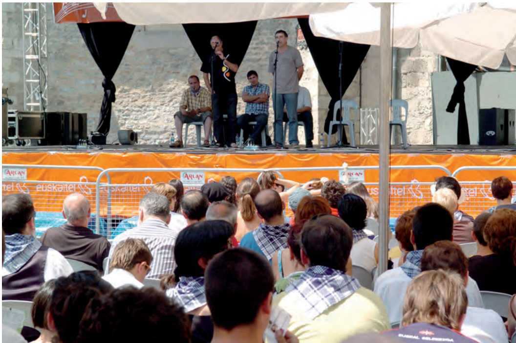
Bertsotze-jaialdia / Festival de bersolaris / Bertsolari festival.

tsitatean ikasitakoak, eta tartean badira literatura idazten dutenak ere. Bertsolari zaharrak gizonezkoak ziren denak –XV. mendean, emakumezko bertsolariak bazirela aipatzen da, hala ere–. Alderdi horretatik ere gauzak asko aldatu dira azkeneko urteotan, gaur egun gero eta emakume gehiago ikusten baitira plazetan bertso kantari. Lau urtez behin jokatzeko da bertsolarien txapelketa nagusia, eta 2009. urtekoan, emakumezko batek irabazi zuen txapela. Funtsezkoa da publikoaren parte-hartzea –txaloak joz, barre eginez, isilik egonez edo adi egonez–