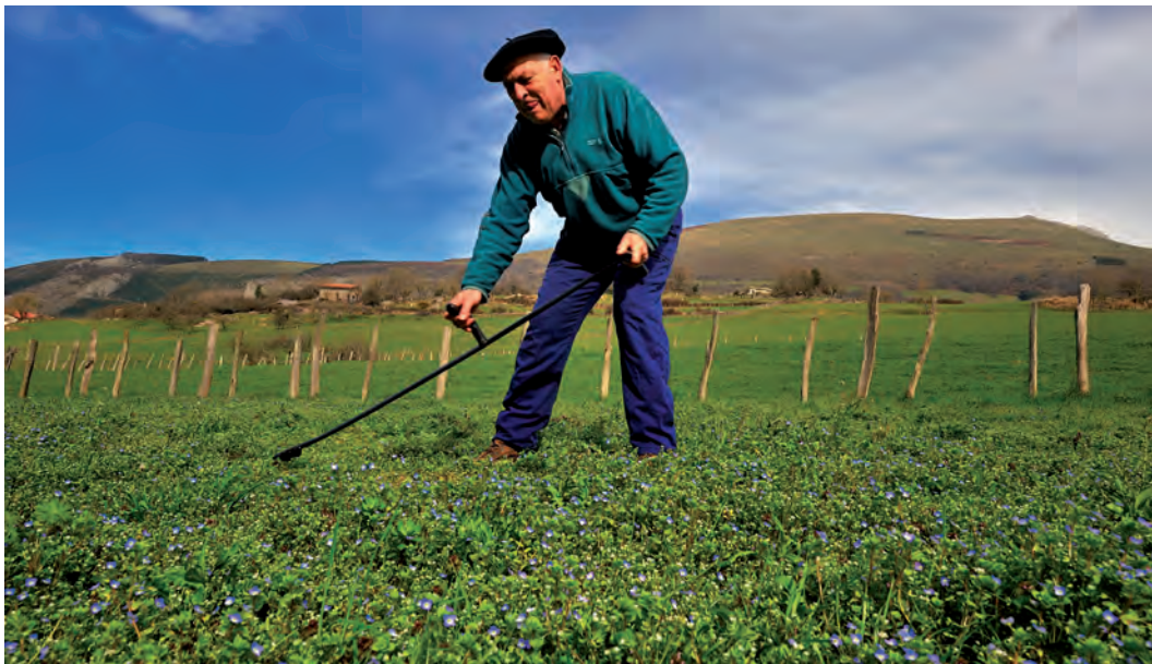
Baserritarra segan / Un campesino segando / A farmer cutting grass with a sega (scythe).

Belazeek ganadua mantentzeko bazka ematen dute. Belar berdea pilatuz, metak egiten dira, belarra ondu eta kontserba dadin; eta gero, neguan, bazkarik ez dagoenean, belar ondu hori ematen zaie aziendei. Belazeak garrantzi handikoak dira baserriaren ekonomiarako; zenbat belar izan, hainbat behi hazi baitaiteke, eta baserri baten balioa dauzkan behi-buruen arabera neurtzen da. Fruta-arbolak ere izaten ditu baserriak: sagarrak, udareak, mertxikak, haranak, gereziak, pikuak, intxaurrek eta gaztainak –adierazgarria da euskaraz fruituaren izenak arbola izendatzeko ere balio izatea–. Animaliei ere ematen zaizkie fruituak. Mendiko lursailetan basoak egoten dira (egurra sutarako, basafruituak eta eraikuntzarako materialak ematen dituzte), garo-sailak (ganaduaren azpiak egiteko erabiltzen da garoa edo ira, eta gero simaurra ateratzen da hortik, lurra ongarrizteko) eta larreak (aziendak bazkatzeko, ardiak batez ere). Baserritarrak zikloen eta urtaroen arabera neurtzen du denbora. Lurra lantzeko zikloa udaberrian hasten da. Apirilaren bukaeran artoa egiteko prestatu behar