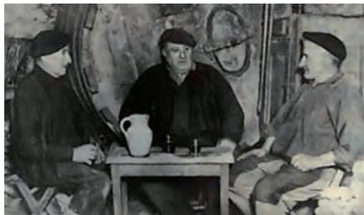
Bertsolariak sagardotegian / Bersolaris en una sidrería / Bertsolaris in a cider house.

Es la combinación del arte verbal, la actuación, la creatividad textual y la voz social aquello que dota a