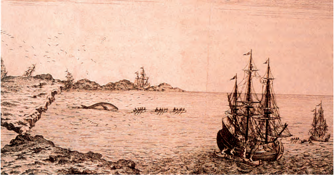
XV. mendeko balea-arrantzaren ilustrazioa / Ilustración de la caza de ballenas del siglo XV / Illustration of whaling in the 15th century.

En el País Vasco, al igual que en gran parte de la Europa rural, la pesca es una alternativa a la agricultura, en lugar de ser un estilo de vida complementario. Esto es cierto, aunque la comunidad costera bien puede contener agricultores ( baserritarrak ) así como pescadores ( arrantzaleak ), puesto que los dos sectores representan marcadamente modos de vida distintivos.