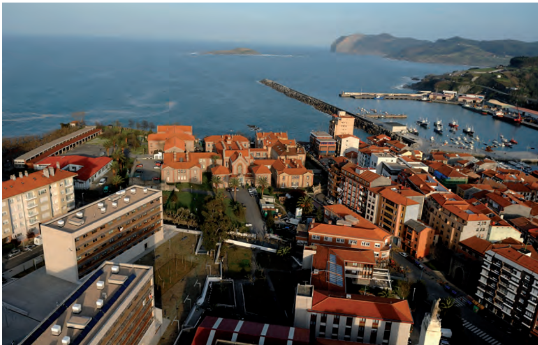
Bermeo / El pueblo vizcaíno de Bermeo / Bermeo, in Bizkaia.

zunak. Normalean, emakumeek gobernatzan dute etxea; beraiek eramaten dituzte diru-kontuak eta beraiek ezartzen dituzte familiaren lehentasunak. Hori dela-eta, emakume zailduak izaten dira, nortasun handikoak, oztopoak oztopo beti aurrera egiten dutenak. Adibidez, euskal gizartean, emakume bat “kasta gogorrekoa” edo izaeraz menperatzailea dela adierazteko, “Bermeokoa” ematen duela esaten da. Arrantzalearen emaztea gogorra eta bere buruarengan konfiantza handia duena bada, senarra justu kontrakoa izaten da. Urtean denborarik gehiena etxetik kanpo igarotzen du, eta harreman estuak ditu barkuko beste marinelekin, baita lehorrean direnean ere; etxean, ordea, bigarren mailako papera du eta ia ez du “agintzen”, bere etxean arrotza dela ez esatearren.