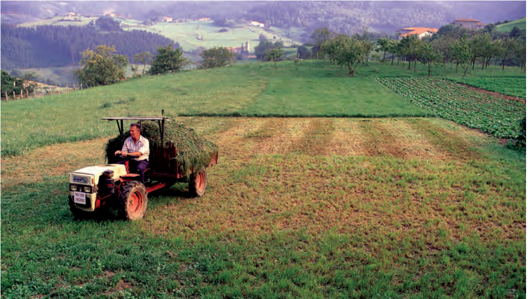
Belar moztu berria traktorean biltzen / Recogiendo en el tractor la hierba recién cortada / Gathering recently mowed grass by tractor.

tario y su mujer eligen de entre su descendencia a un único heredero del caserío. En muchos lugares del País Vasco esta selección viene determinada por el primogénito varón; sin embargo, hay muchas excepciones. Asimismo, se supone que los hermanos del heredero seleccionado deben irse. Tradicionalmente, sus opciones eran casarse con miembros de otras explotaciones agrarias cercanas, entrar en el clero, emigrar a zonas urbanas o bien emigrar a otros países.