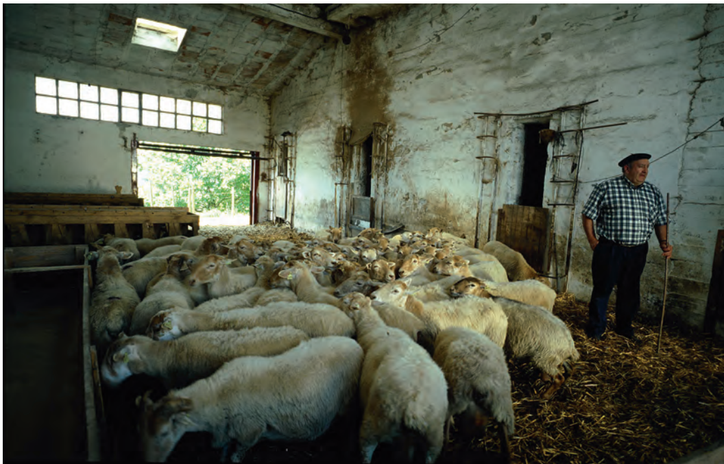
Artaldea artegian / Un rebaño de ovejas en el establo / A flock of sheep in a barn.

bizitzeko behar zen guztia; ez zegoen azokara joan beharrik gauzak erostera. Dieta sinplea zen: zopa, taloak eta morokilak, ahia, esnea, esnekiak, babarrunak eta oso aldian behin okela. Oinarrizko janariak hiru ziren: gaztainak (erreta jaten zirenak edo pure eginda zopan), taloak eta babarrunak. Janari horiek guztiak baserrian bertan egiten ziren. Edari nagusiak esnea eta sagardoa ziren, eta horiek ere etxean egiten ziren. Baserriak beste janari batzuk ere ematen zituen: eztia, azukrearen ordez erabiltzen zena, fruituak eta haragia, txerriak batez ere. Urtean behin txerri bat hiltzen zuten; gero, haren haragia ontzen jarri eta urte osoan irauten zuten.