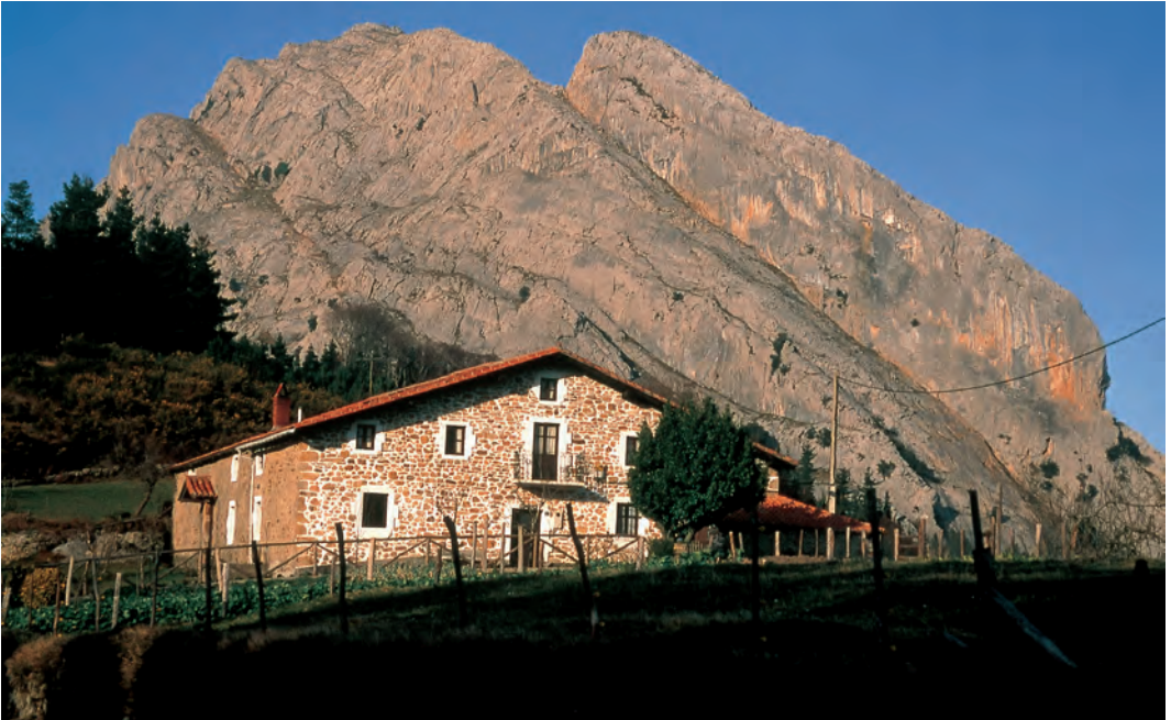
Baserrí bat / Un caserío / A baserri farmstead.

La sociedad vasca tradicional está anclada en la institución de la explotación agraria del caserío. Se trata de un objeto de estudio popular por parte de folcloristas y antropólogos. Aunque su relevancia económica actual es insignificante, su trascendencia histórica y cultural es mucho mayor.