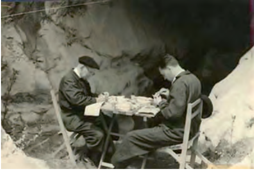
Jose Miguel Barandiaran ikerketa-lanean / José Miguel Barandiarán realizando trabajo de campo / Jose Miguel Barandiaran doing field-work.

Euskaldunak, Europaren barruan, gizarte eta kultura moderno eta postindustrial batean bizi dira. Hala ere, tradizioa euskaldunen nortasun politikoaren eta kulturalaren funtsezko partea da gaur egun ere.