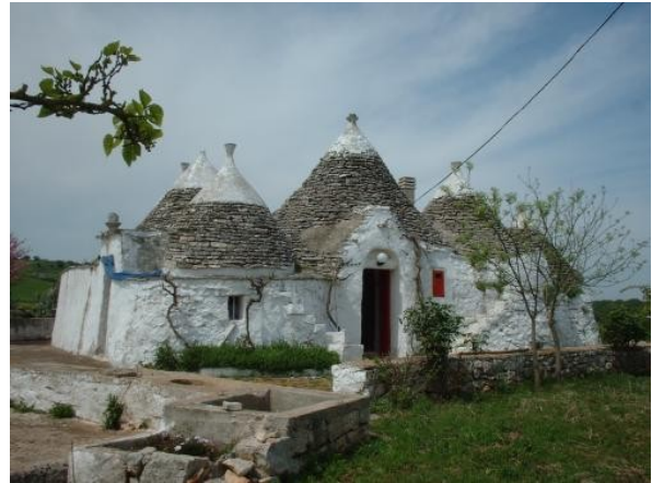
Un tipico trullo in campagna

Ed ecco che il laborioso e inventivo lavoro dei contadini ha prodotto questo nostro paesaggio: terreni geometricamente divisi dai muretti a secco, uliveti, vigneti e frutteti e... una miriade di trulli (se ne contano a migliaia per la maggior parte utilizzati e in buono stato di conservazione).