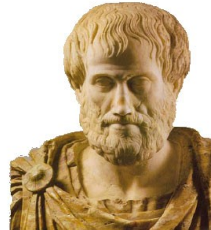
Aristoteles (384 v. C. - 322 v. C.)

1 helderheid, 2 passendheid, 3 'ongewoonheid' (metaforen)