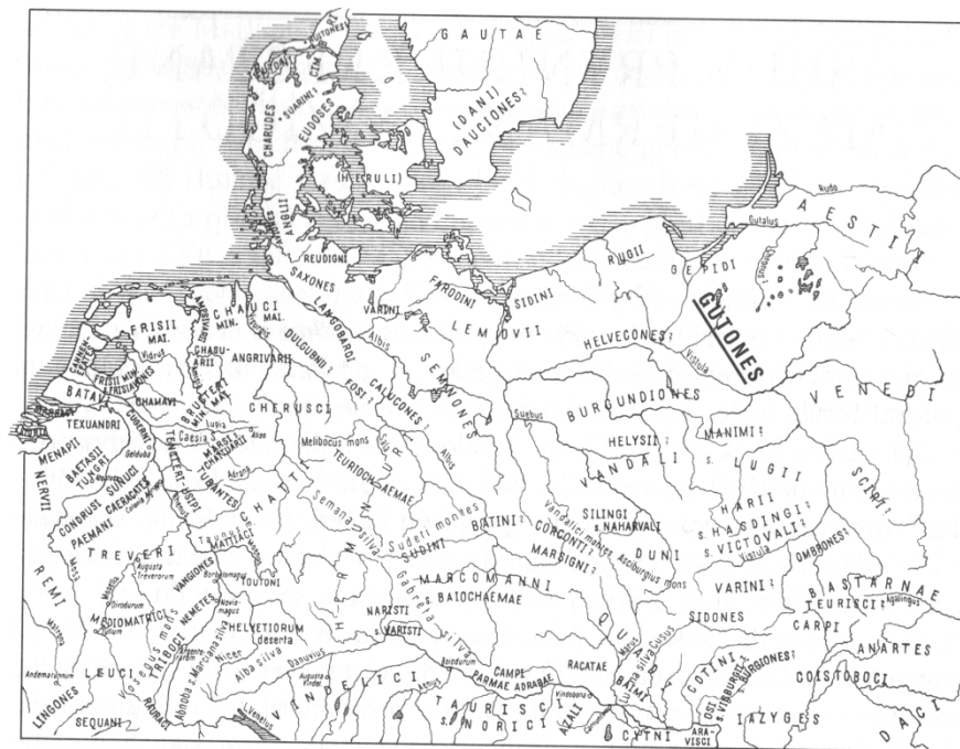
Přibližná sídla Gothonů a ostatních germánských kmenů podle Tacitova spisu Germania