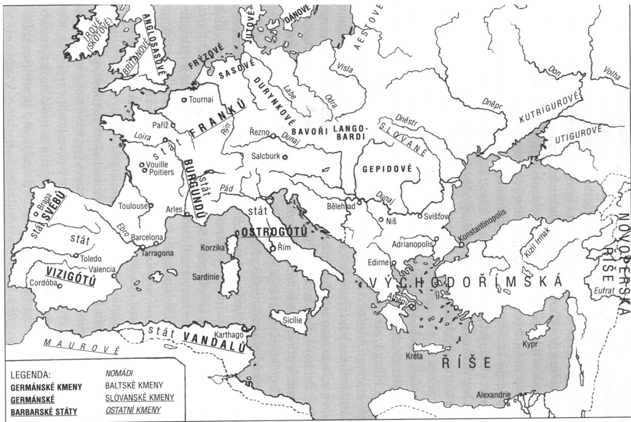
Germánská království z doby velkého stěhování národů (k r. 526)