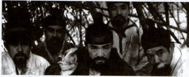
Leť vysoko, leť daleko (1991). r. Im Kwon-tek

V týlu nepřítelů (1951), Vetřelci (ruský titul Dívka partyzána , 1954), Řeka Orang (1956), Pouto naděje (1959) a spolu s režisérem Ju Won-džunem se podílel i na režii širokoúhlého barevného velkofilmu Vyprávění o Čchun-hjang (1979); všechny jmenované tituly byly uvedeny u nás. Celkem vzniklo mezi druhou světovou a korejskou válkou v obou částech země asi šedesát celovečerních snímků.