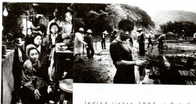
Jediná jiskra 1995, r. Pak Kwan-su

duktům, a to v kvótě platné pro každé kino: dva korejské filmy ku třem zahraničním. Znamenalo to samozřejmě i otevření korejského trhu pro filmy z jiných teritorií včetně Evropy, což dříve nebylo možné. V osmdesátých letech rostl počet kin (ze 466 v roce 1980 na 640 v roce 1986); tento proces však zároveň znamenal nahrazování velkých tisícisedadlových sálů menšími projekčními místnostmi do dvou set diváků; malé sály tvořily na konci dekády už přes polovinu z celkové nabídky.