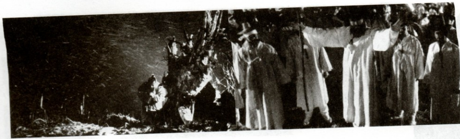
Let vysoko, let daleko (1991), r. Im Kwon-tek

1964 natočil stovku. K nejlepším filmům Kim Su-jonga patří Vesnice na mořském břehu (1965), Miha (1967) a Na konci podzimu (1981).