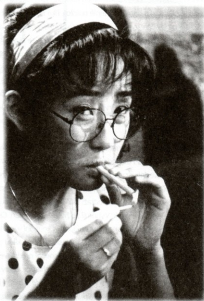
Má láska, má nevěsta (1991) . r. I Mjong-se

E xistuje něco jako typický styl korejského filmu? Čím se vyznačuje? Lze vůbec nějak zobecnit to, co nabízejí snímky žánrově a stylisticky tak rozličné?