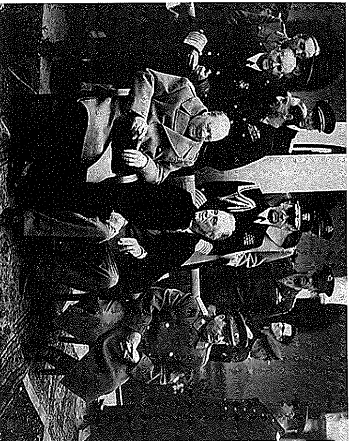
Hlavní protagonisté Jaltské smlouvy: W. Churchill, F. D. Roosevelt a J. V. Stalin

Stalin se tím v žádném případě nedal zmást; sotva krymská konference skončila, vyslal do Rumunska Vyšinského, oblibeného soudce z velkých procesů třicátých let, aby tam doručil králi Michalovi ultimátum a dosadil komunisty kontrolovanou vládu. V téže době se do Moskvy vydala delegace polských odbojářů z nekomunistické Zemské armády, aby se účastnila ustavení poválečných institucí, a byla hned po příjezdu zatčena. V nikdy neodslaném dopise Rooseveltovi vyjádřil Churchill výslovně vztah mezi Jaltskou dohodou a následujícími událostmi: „Nedáme-li to okamžitě do pořádku, svět brzy usoudí, že jsme svým podpisem Krymské dohody parafovali cár papíru.“ 8 Nemýlil se. Jalta byla prohra, ne pro jakousi mytickou dějbu světa, ani — po pravdě řečeno — proto, že Západ nedokázal zadžet sovětské plány ve střední Evropě, ale protože dohoda spočívala na pochybné hypotéze, že Stalin a západní představitelé dávají stejný význam slovům jako demokracie, suverenity nebo nezávislost, a protože konkrétní význam těchto slov v předpokladech ustavení budoucí polské vlády se v praxi rovnal západnímu přijetí sovětského dvojjihy jazyka o „lidových demokraciích“.