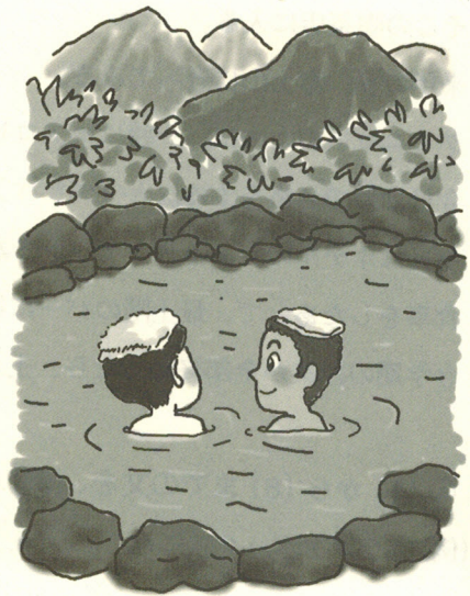
やっぱり最高、露天風呂！