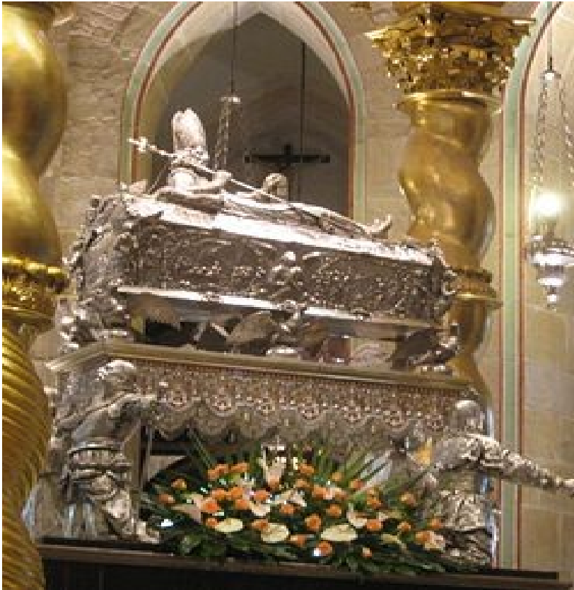
Stříbrný barokní relikviář a náhrobek sv. Vojtěcha v hnězděnské katedrále