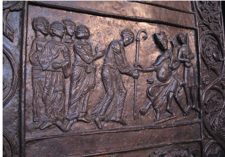
Fragment z hlavních chrámových dveří znázorňujících život sv. Vojtěcha (okolo 1175)