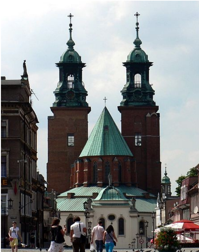
Katedrála Nanebevstoupení Panny Marie v Hnězdně