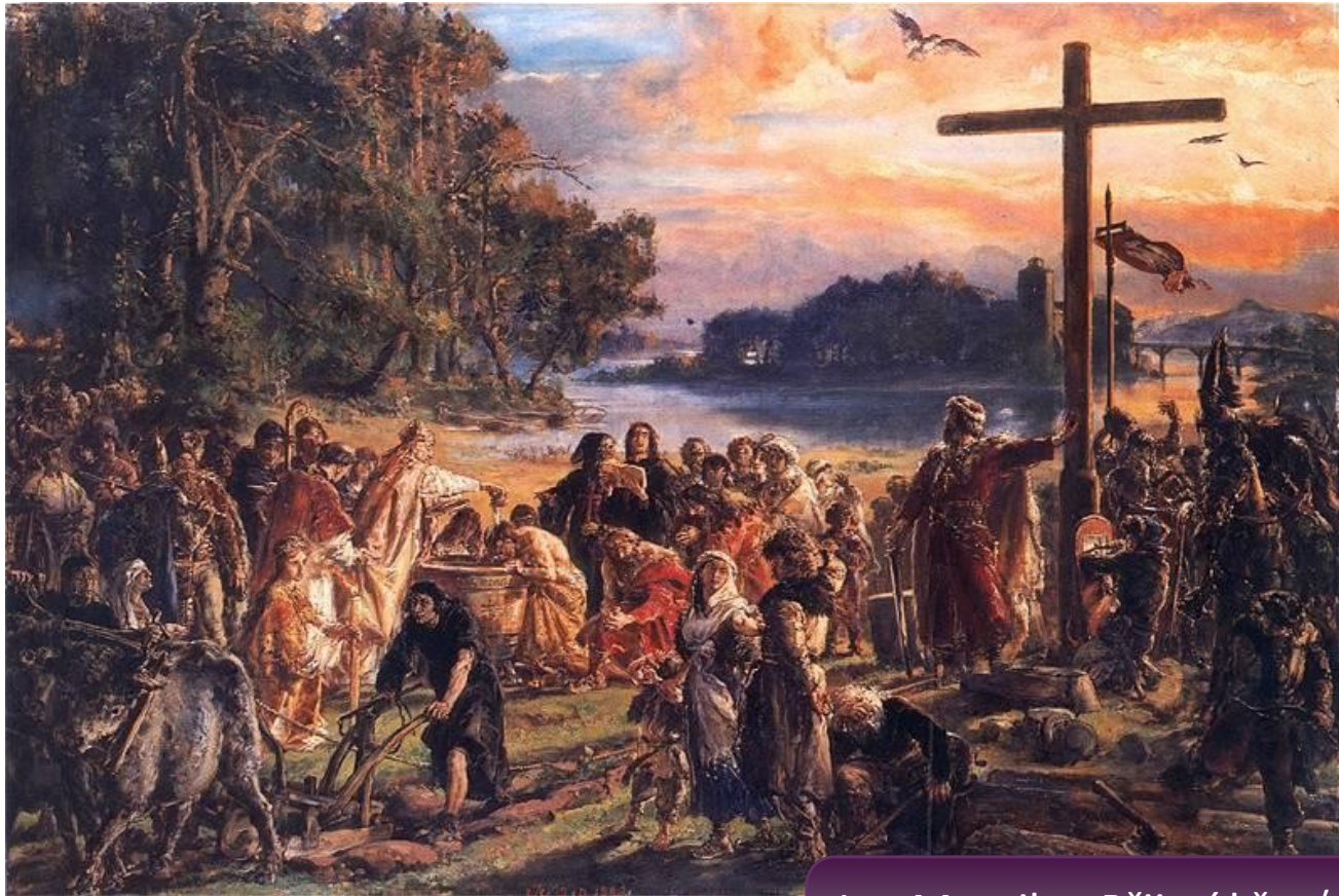
Jan Matejko: Přijetí křesťanství (Zaprowadzenie chrześcijaństwa)