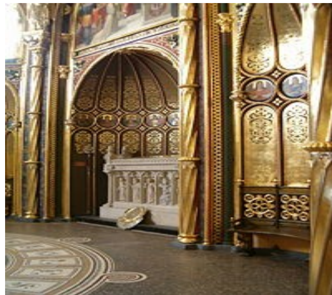
Tzv. Zlatá kaple v poznaňské katedrále