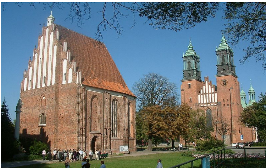
Katedrála sv. Petra a Pavla v Poznani