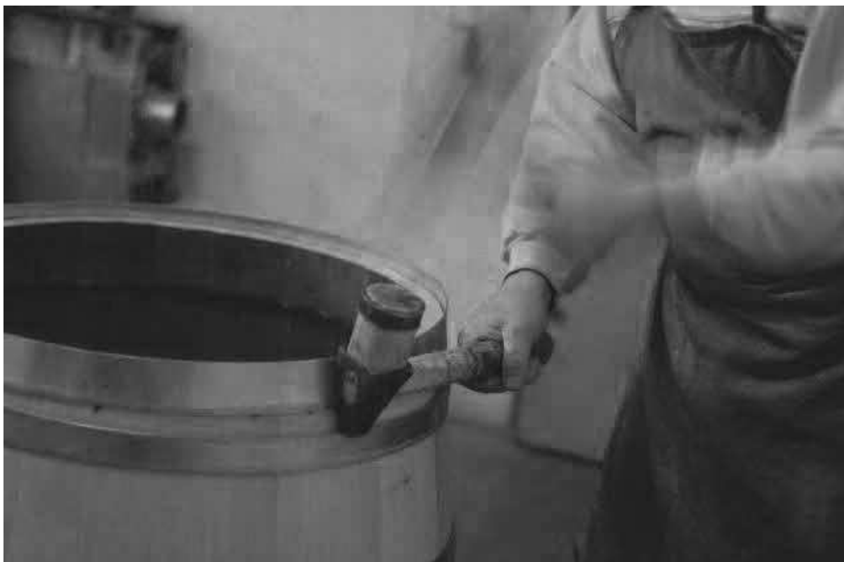
Zatloukání obrouček u sudu