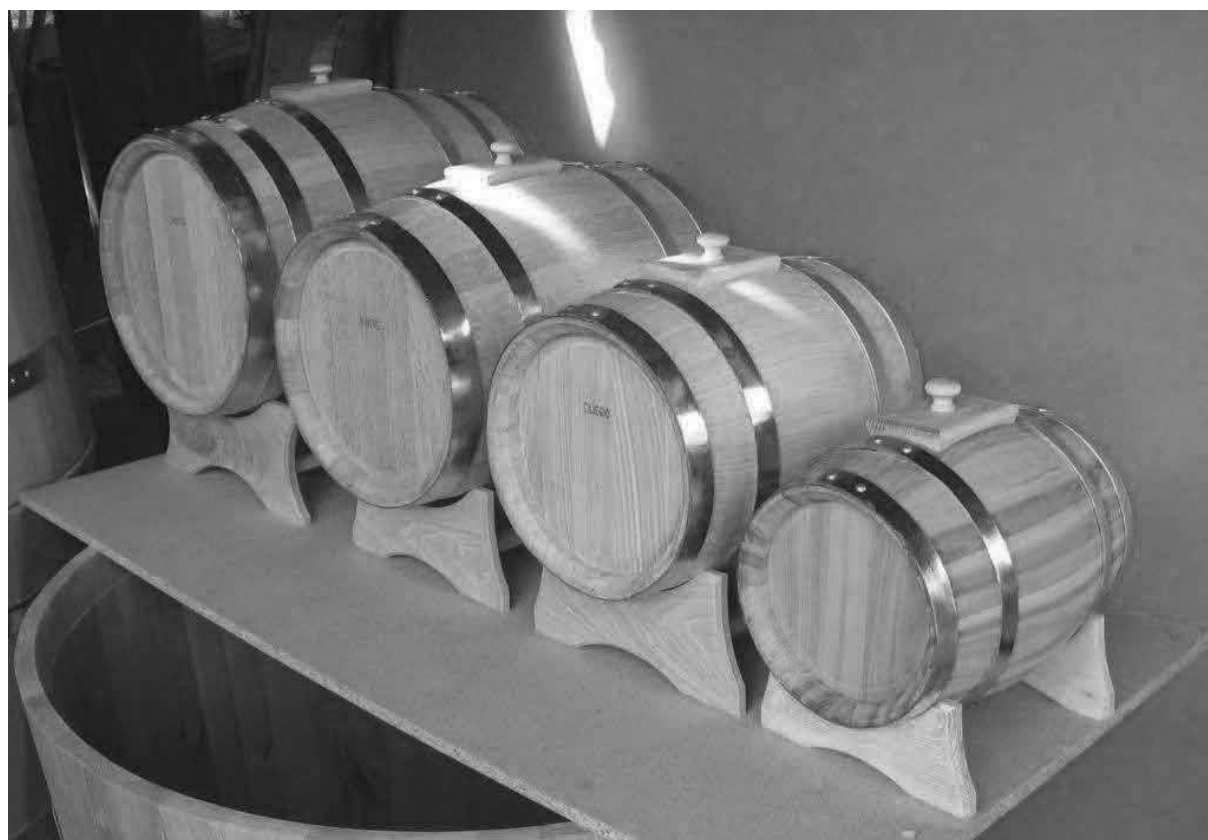
Sudy na vinný ocet.