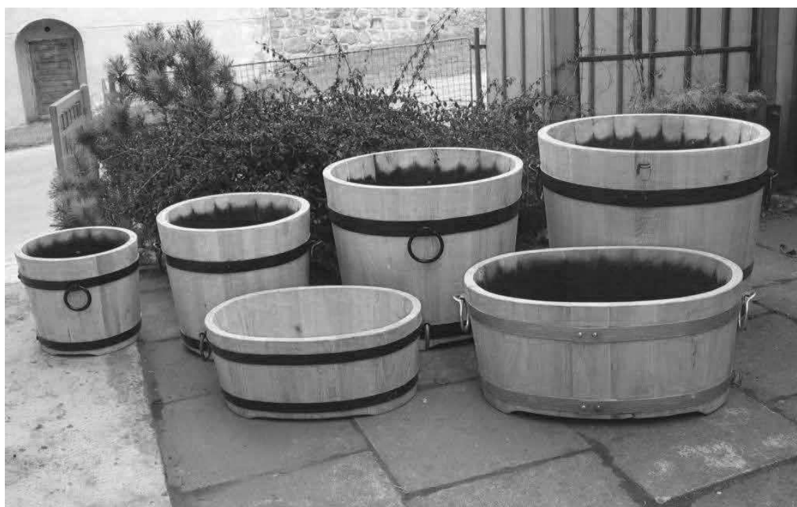
Kruhové a oválné kádě.