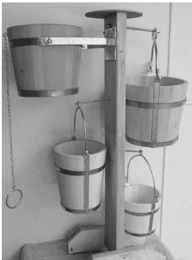
Vědra na vodu.