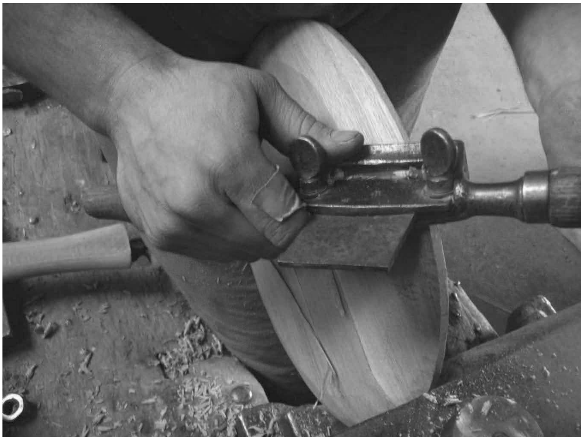
Výroba a opracování dna sudu