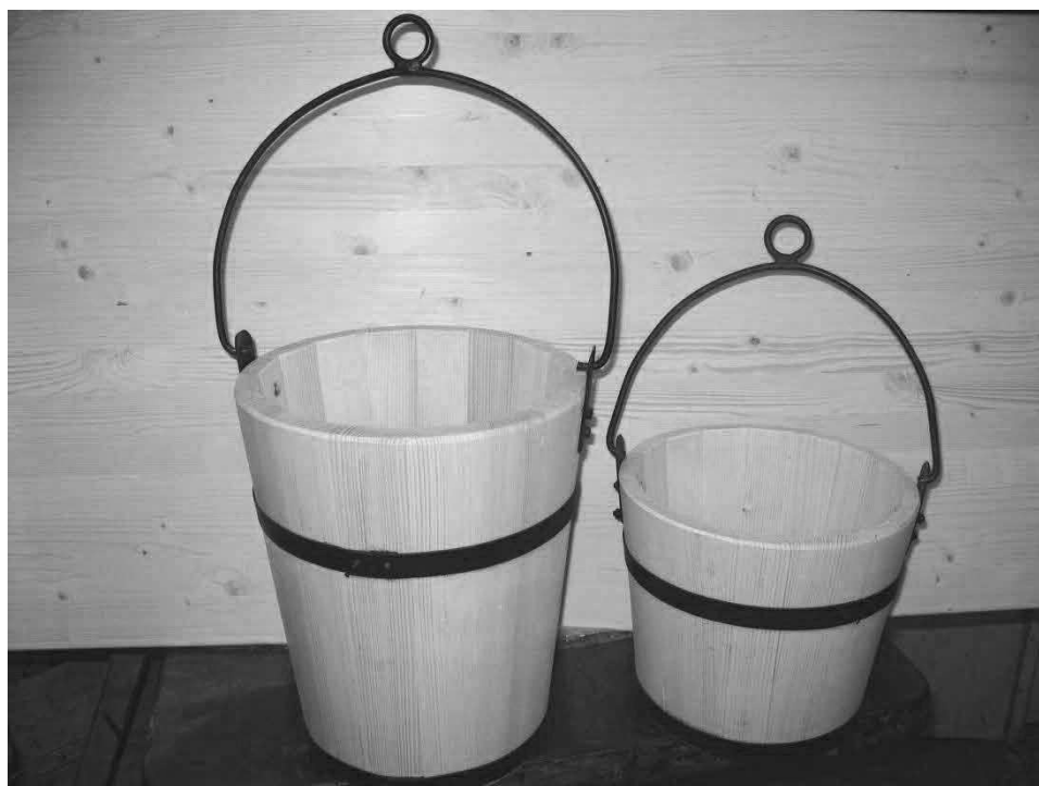
Vědra na vodu