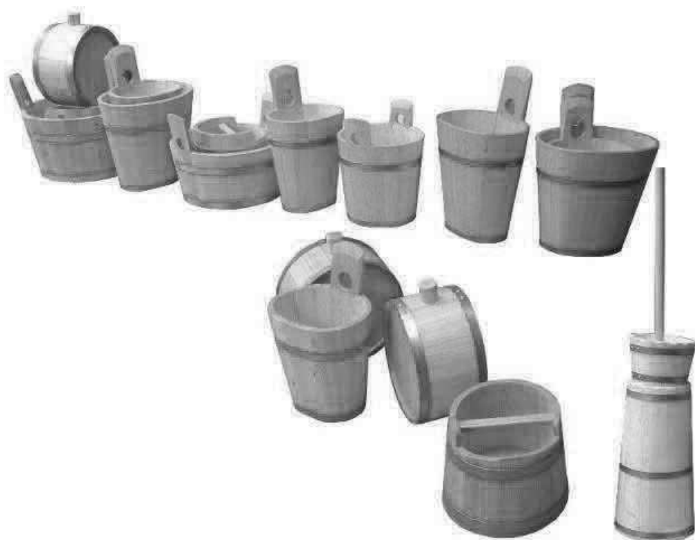
Putny, škopky, máslenka a další drobné bednářské výrobky