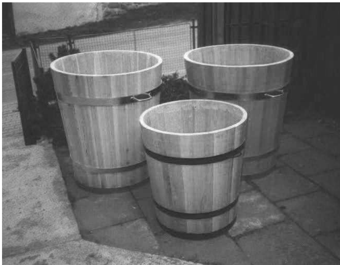
Kádě na kvas.