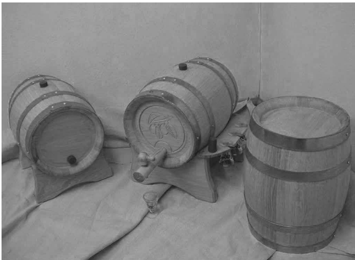
Soudky na destiláty.