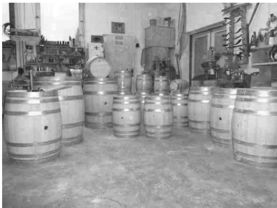
Sudy různých velikostí v dílně.