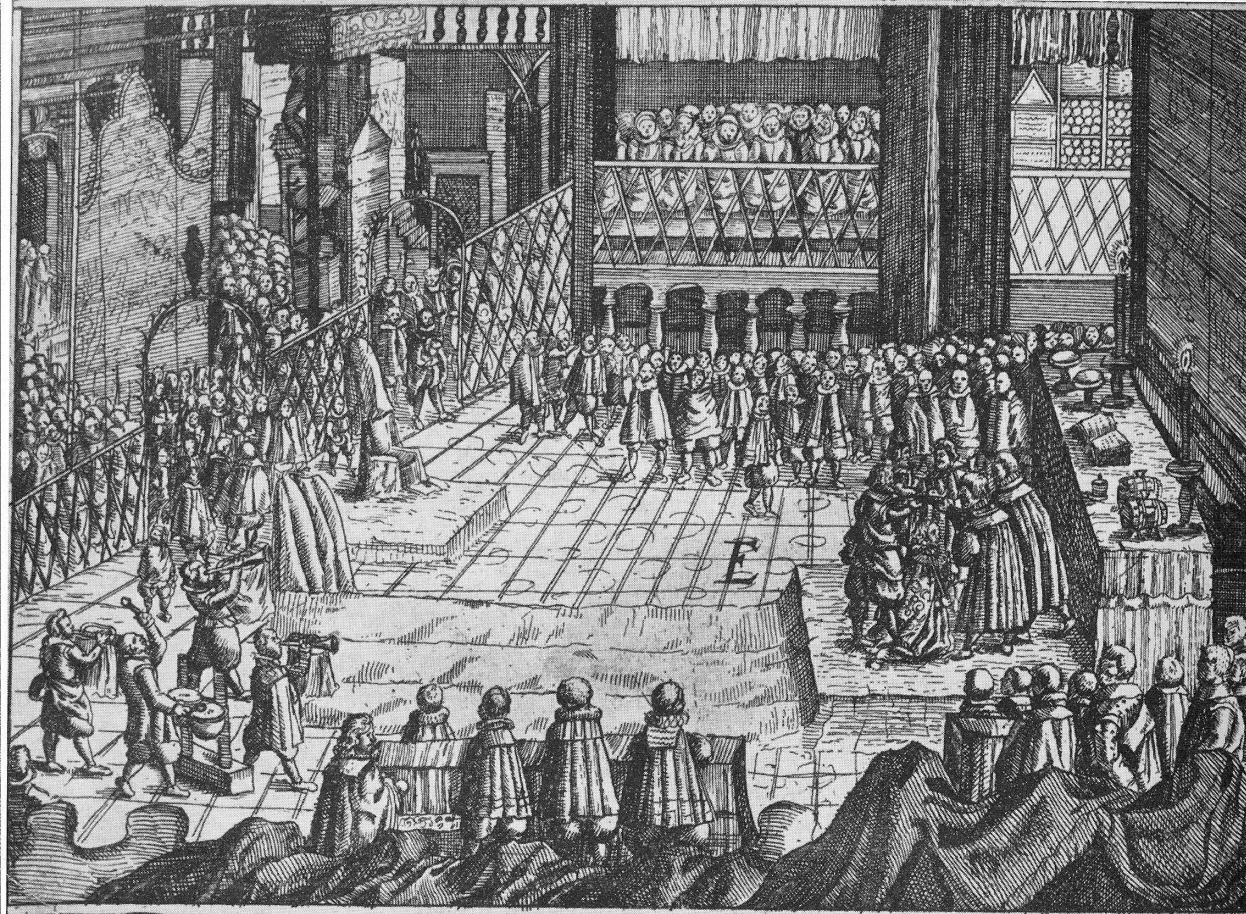
126–127) Hudba při korunovaci Fridricha Falckého v katedrále sv. Víta v Praze / 1619 Musik bei der Krönung Friedrichs von der Pfalz in der St. Veits-Kathedrale in Prag / 1619 The band at the coronation of Frederick of the Palatinate in St. Vitus Cathedral in Prague / 1619