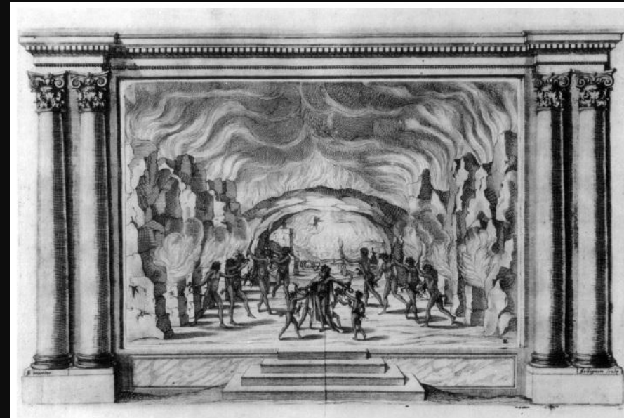
1. Stage set from Il S. Alessio , 1634, pl. 2, engraving.