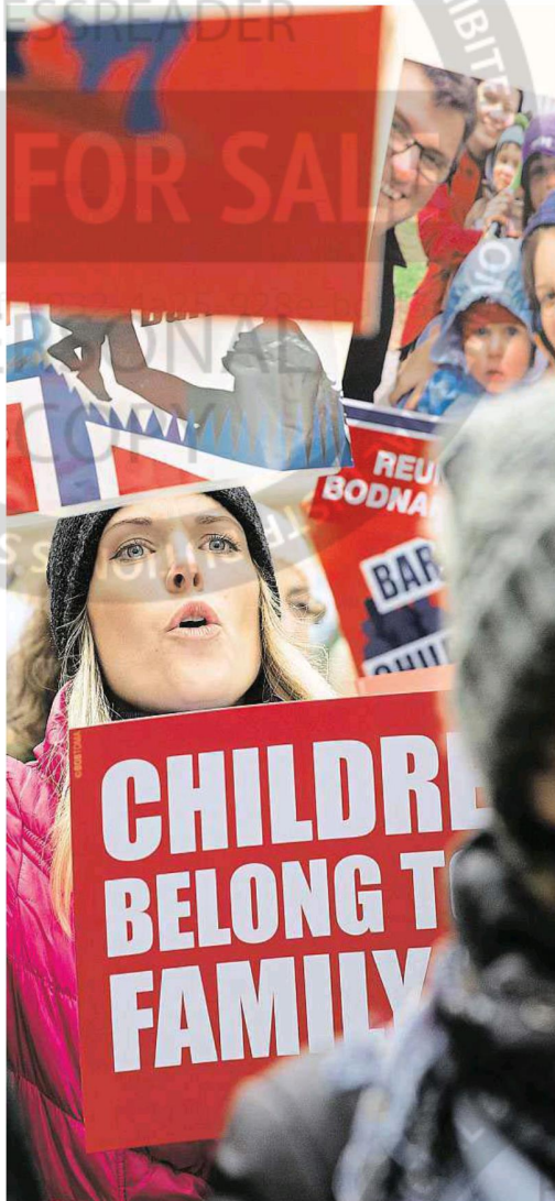
Z demonstrace proti Barnevernetu v Praze 16. ledna 2016