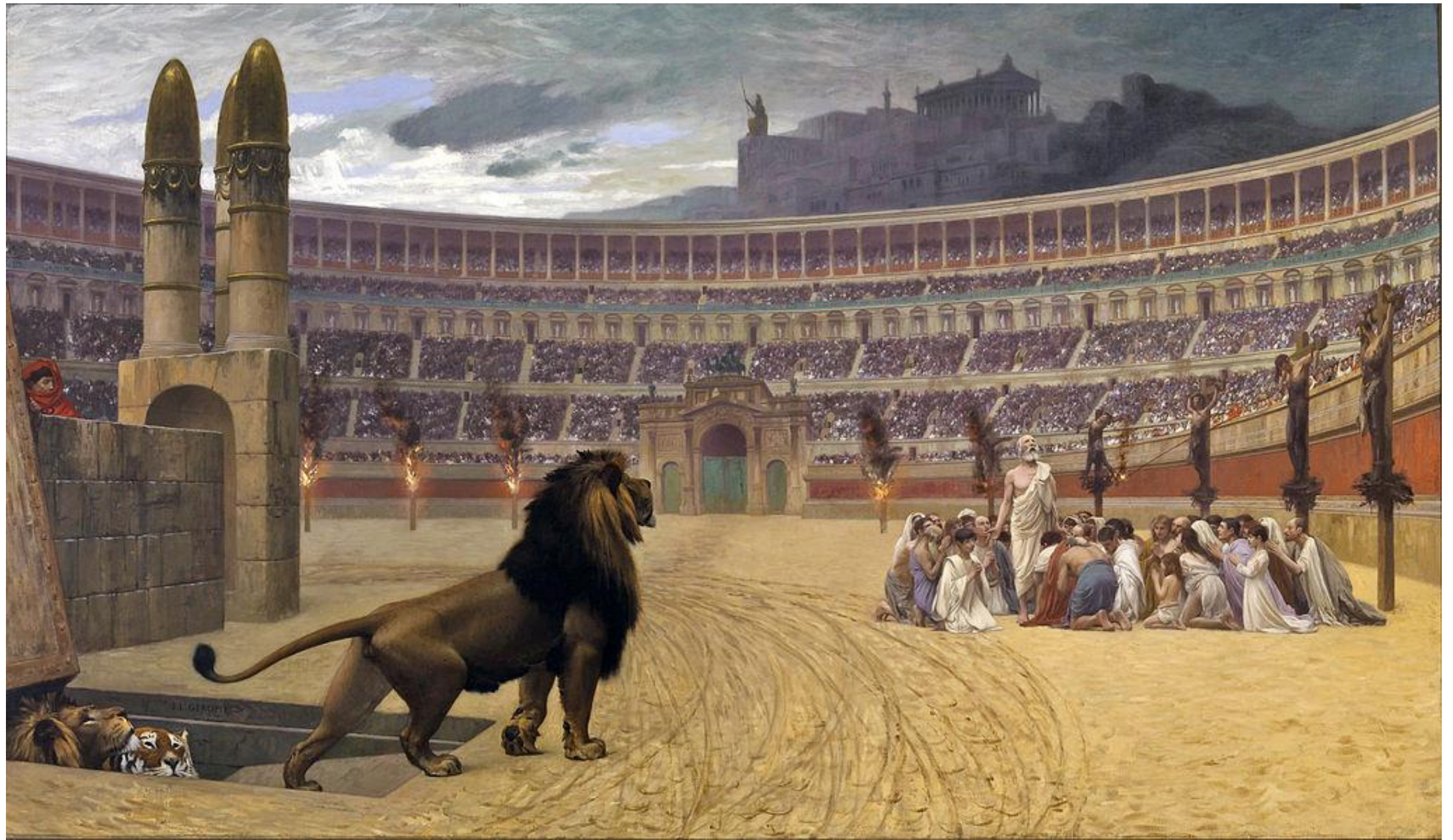
Jean Léon Gérôme (1824-1904)