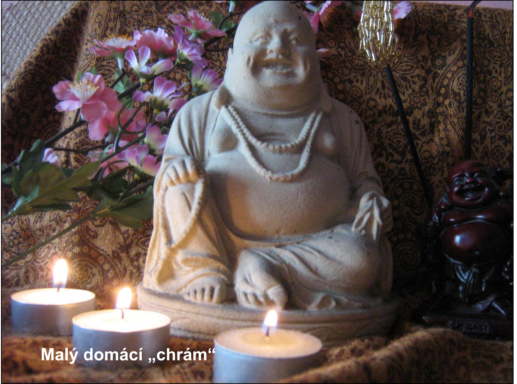
Malý domáci „chrám“