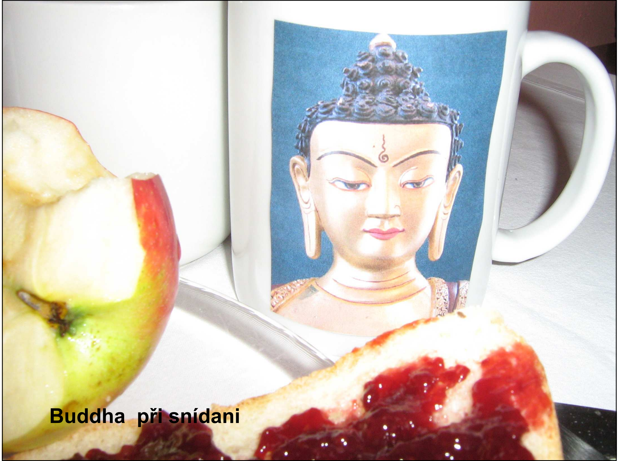
Buddha při snídani