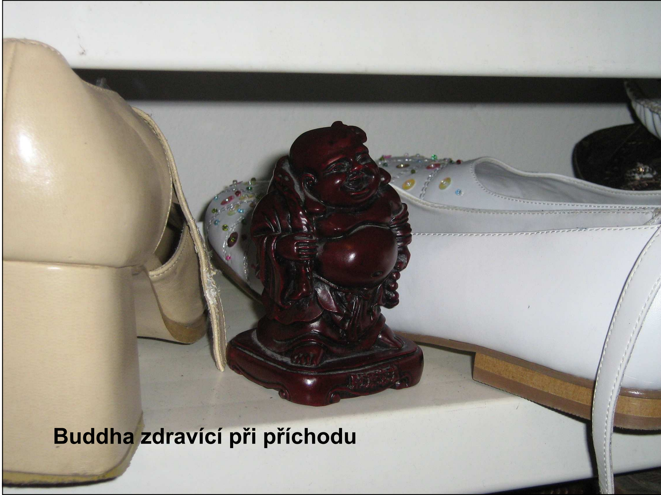
Buddha zdravící při příchodu