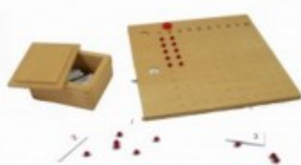
Tabulka pro násobení