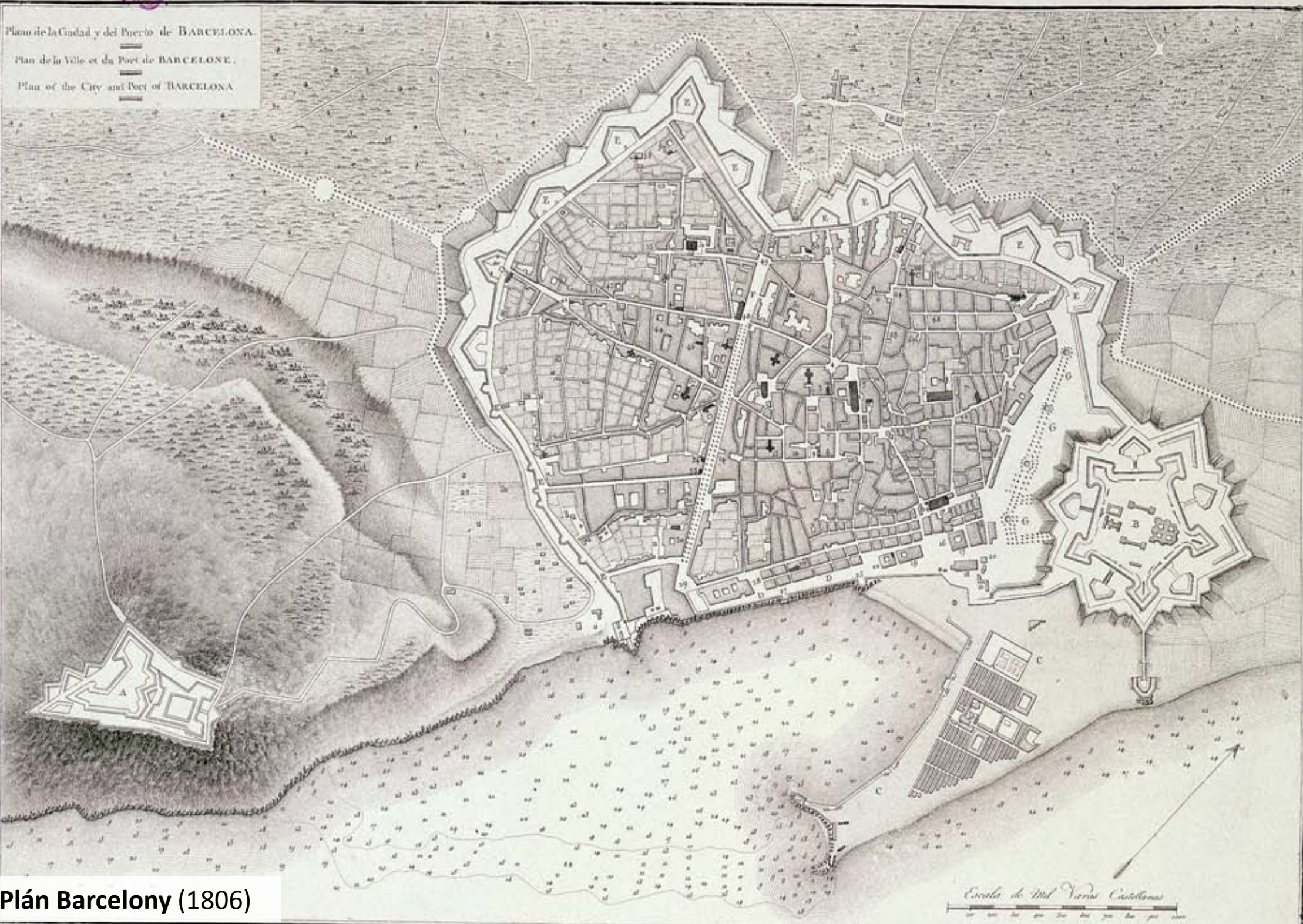
Plán Barcelony (1806)

Plano de la Ciudad y del Puerto de BARCELONA. Plan de la Ville et du Port de BARCELONE. Plan of the City and Port of BARCELONA.