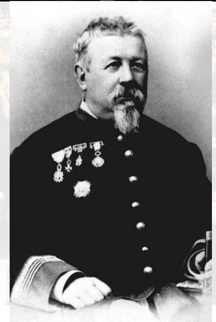
Nahoře: Ildefons Cerdà