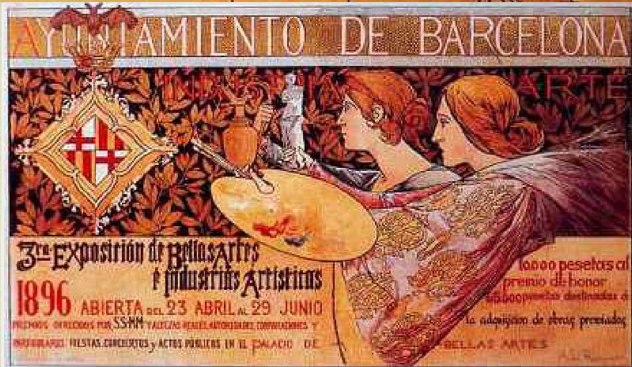
Ukázka plakátů z dílny A. de Riquera