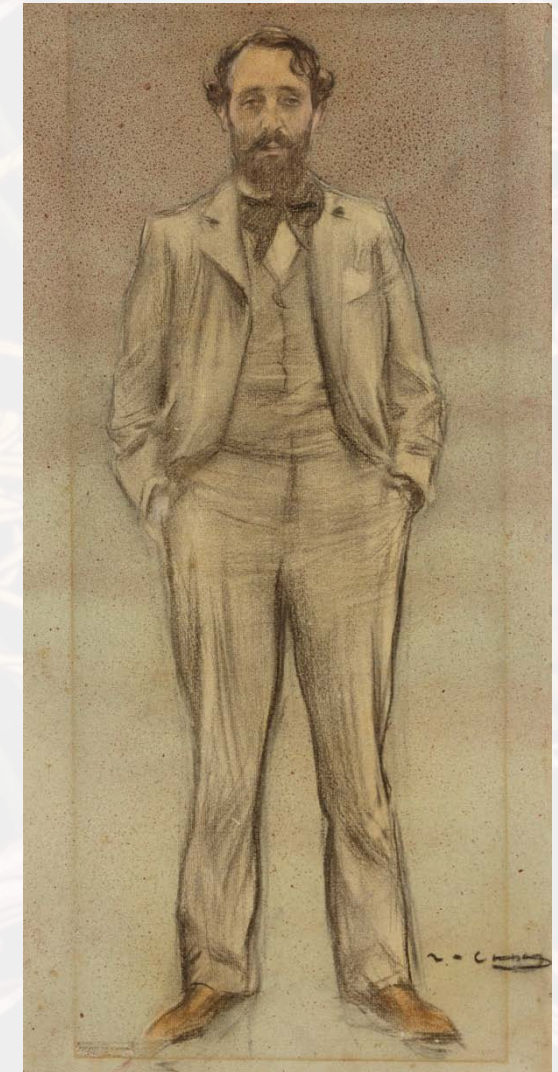
Enric Clarasó (portrét R. Casase)