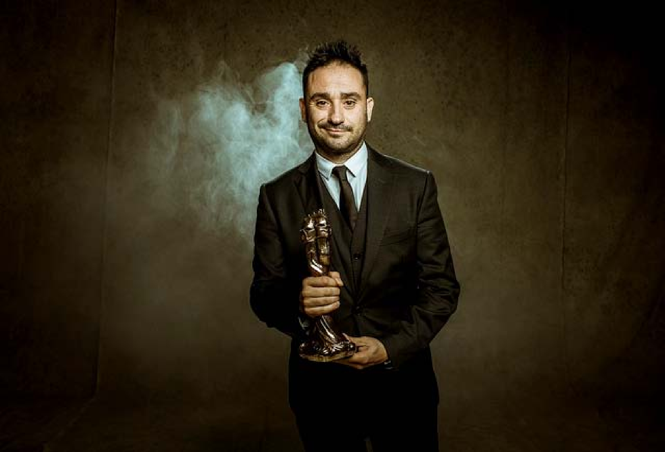
Juan Antonio Bayona