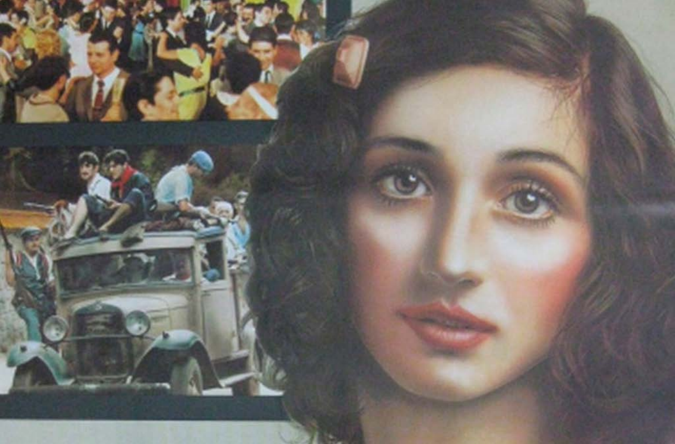
La plaça del Diamant (1982, re ie: Francesc Betriu)