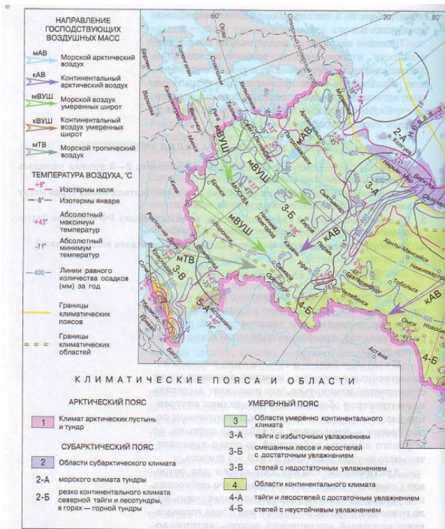
Рис. 38. Климатические пояса России