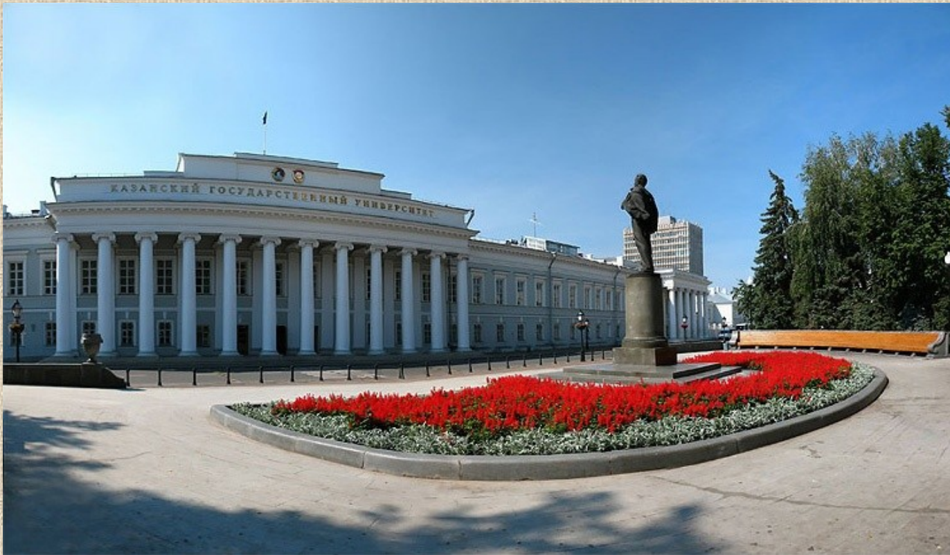
Главный корпус КФУ