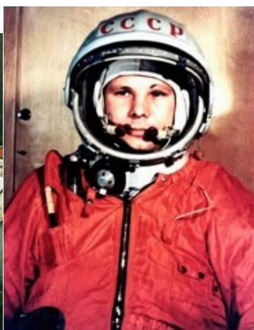
Гагарин Юрий Алексеевич