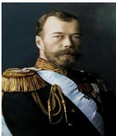
Николай II Александрович