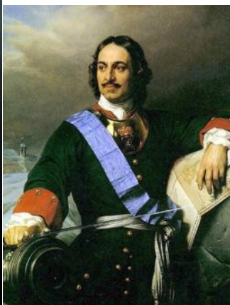
Петр I Великий