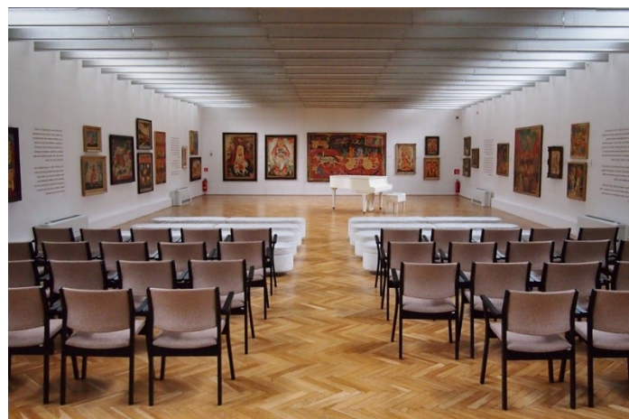
Obr. 4: Interiér, poschodie-výstavná sieň.