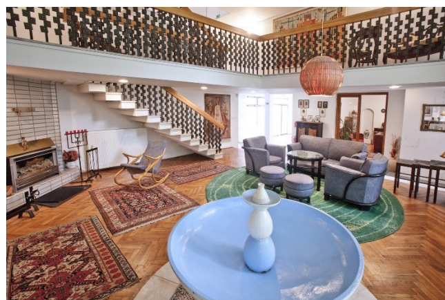
Obr. 5: Interiér, prízemie-byt.