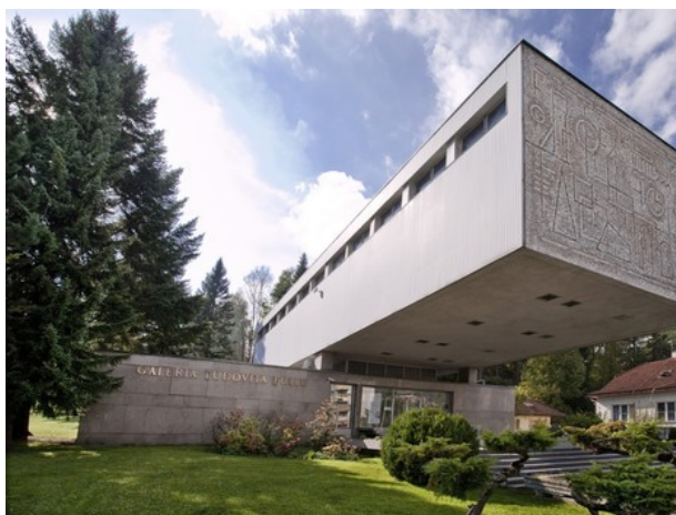
Obr. 1: Galéria Ludovíta Fullu.