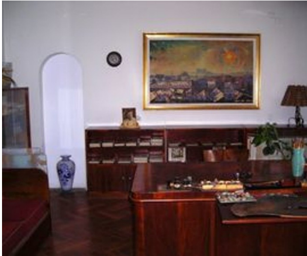
Obr. 7: Interiér, prízemie-pracovňa.