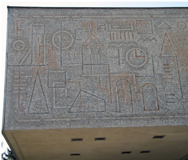
Obr. 2: Detail mozaiky.