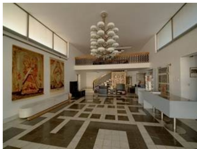
Obr. 6: Interiér, prízemie-vstup.