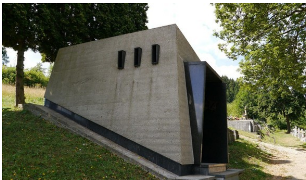
Obr. 8: Hrobka E. Fullu.