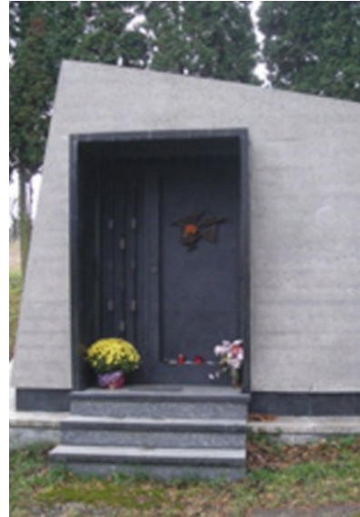
Obr. 9: Hrobka E. Fullu, vstup.